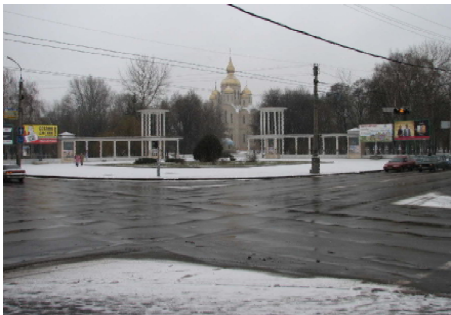
Рис. 2. Панорама парку з новозбудованою Св. Михайлівською церквою