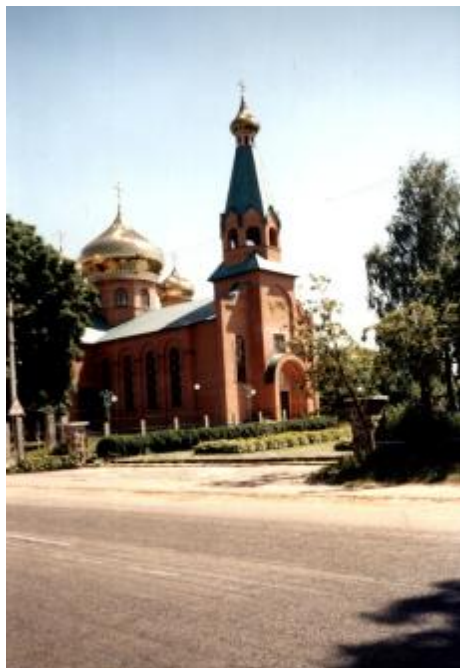
Рис. 3. Невдале розташування нової церкви в с. Яснозір'я Черкаської області поряд із магістраллю „Черкаси-Київ”