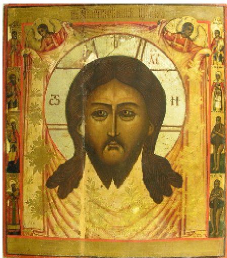
Рис. 1. Спас Нерукотворный. Частная коллекция, г.Харьков