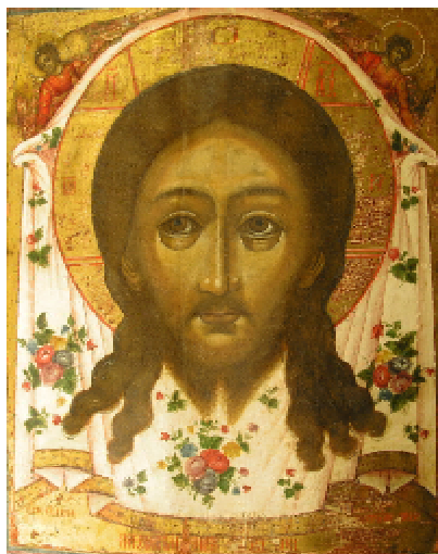
Рис. 2. Спас Нерукотворный. Частная коллекция, г.Харьков