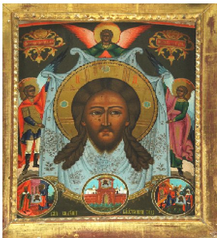
Рис. 3. Спас Нерукотворный. Ветковский музей народного творчества