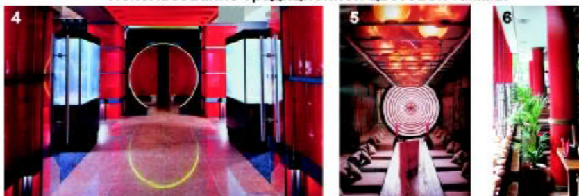
4 ресторан "Шан" г. Киев