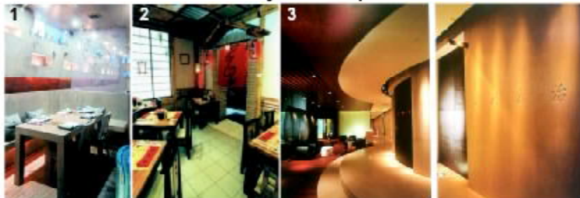
1 ресторан "Данти": Киев Суши Бар "Нобу" : Киев