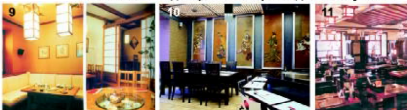
9 суши бар "Кампай" г. Киев авт. Н.Шахрай