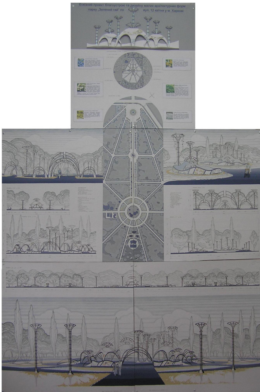
Рис. 2. Эскизный проект благоустройства территории и ландшафтного дизайна парка «Зеленый гай» г. Харькова. Ст. 5 к. «ИО» Повидиши А. Рук: доц. Алексеенко А.М., ст. преп. Северин В.Д.