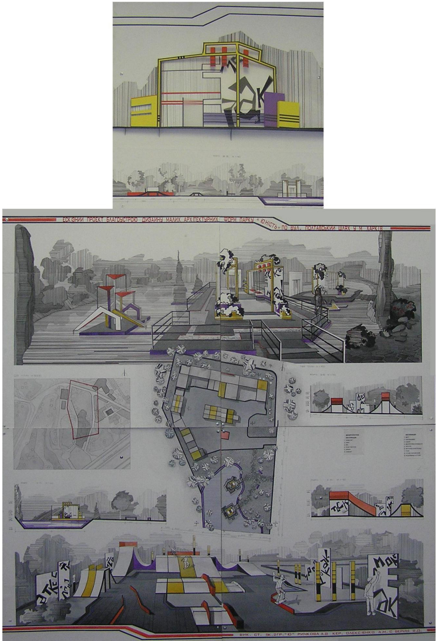
Рис. 3. Эскизный проект благоустройства территории и ландшафтного дизайна парка «Зустріч» г. Харькова. Ст. 5 к. «ІО» Рычкова А. Рук: доц. Алексеенко А.М., ст. преп. Северин В.Д.