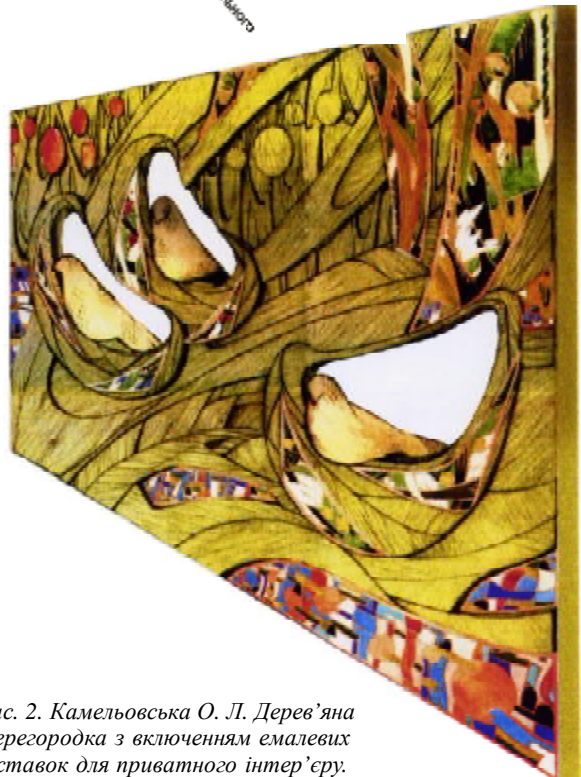
Рис. 2. Камельовська О. Л. Дерев'яна перегородка з включенням емалевих вставок для приватного інтер'єру.