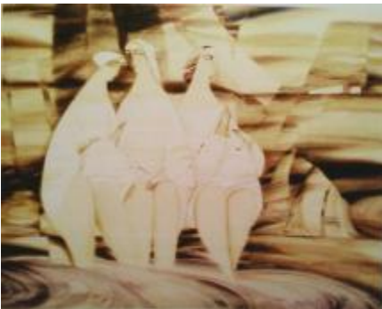
Рис. 7 І. Тафійчук, «Три кралі», 2002, дерево (липа), змішана техніка, 70x80