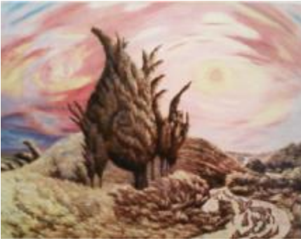
Рис. 5 Г. О. Чернета, «Неспокійний ранок», 1993, полотно, олія, 85x110