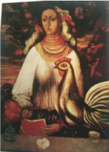
Рис. 2 Ф. М. Гуменюк, «Вірність Україні», 1972, полотно, олія