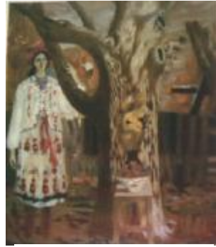
Рис. 6 А. І. Онищенко, «Роздуми», 1991, полотно, олія, 120x100