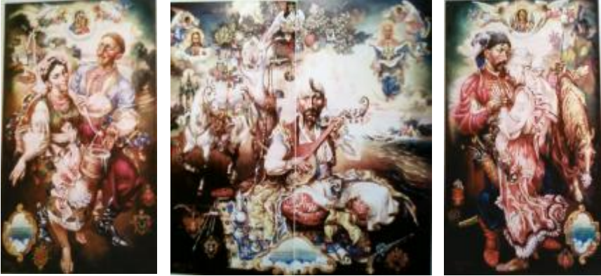
Рис. 1 О. Л. Сопелкін, «Гімн-молитва», 1998, триптих, полотно, олія, 100х250