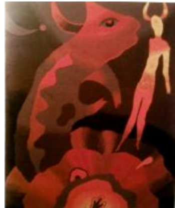
Рис. 4 О. Т. Чегорка, «Поклик вічності», 1995, папір, гуаш, 19х33