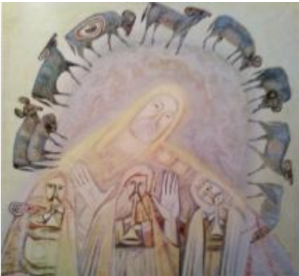
Рис. 9 А. Т. Пуикарьов, «Предтеча з учнями», 2001, полотно, олія, 65x70