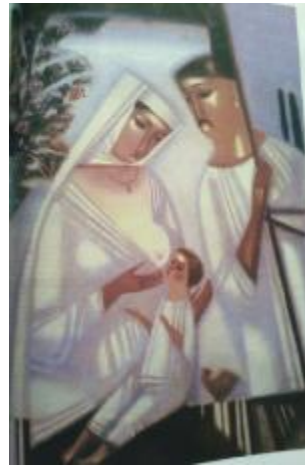
Рис. 8 В. О. Корнєв, «Берегиня», 2001, полотно, олія, 34x29