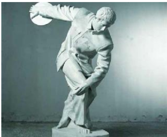
Суй Цзяньго. Складка. Художественный музей, Пекин. 1991

2 этап (70-90-е гг.). Влияние Западного модернизма, структурализма и абстракционизма определило появление множества абстрактных скульптур. Часть из них вошли в историю китайской пластики. Однако наблюдается и обратный эффект: слепое подражание и копирование западных произведений привело к созданию эпигонских, низкого художественного качества объектов, ставших «мусором городов».