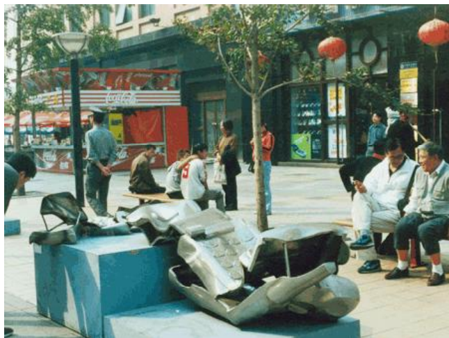
Ли Сюйцзинь. Гиперемия, г. Циндао. 1990