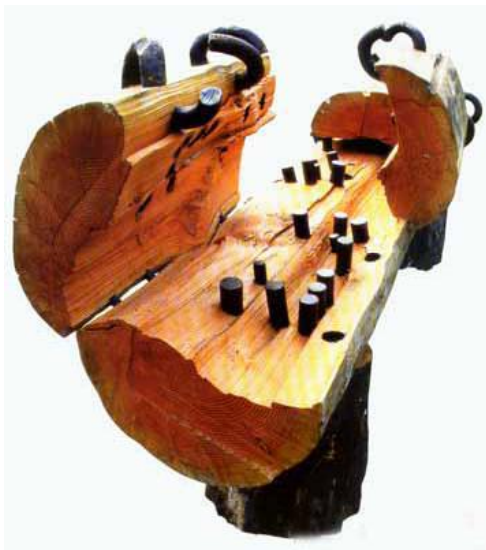
Ли Сюйцин. Установка-дерево. Художественный музей, г. Циндао. 1991