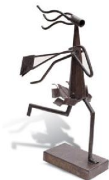
Цинь Пу. Женищина, г. Гуандун, музей. 1991