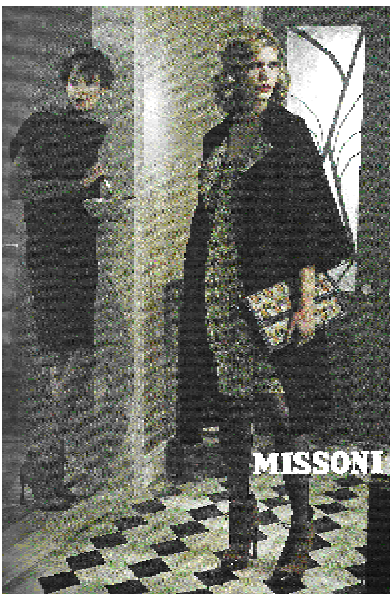
Рис. 3. Реклама колекції осінь-зима 2008 дизайнера Missoni.