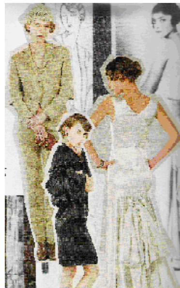
Рис. 4. Моделі з колекції 2008 року відродженого Дому моди Irfe.