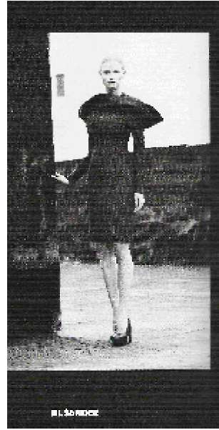
Рис. 2. Реклама колекції осінь-зима 2008 дизайнера Jil Sander