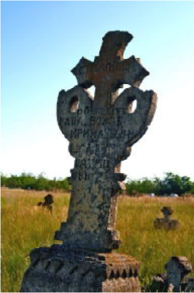
Рис. 5 Кам'яний хрест з візантійським орлом. с. Себіно. Миколаївська обл. Початок XIX ст.