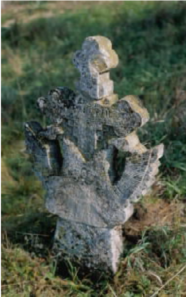
Рис. 1 Кам'яний трилистий хрест з візантійським орлом. с. Михайлівка. Миколаївська обл. Кінець XIX ст.