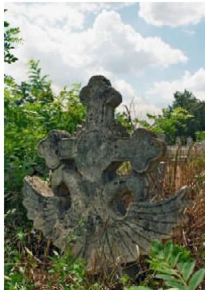
Рис. 8 Кам'яний хрест з візантійським орлом. м. Вознесенськ. Миколаївська обл. Початок XIX ст.