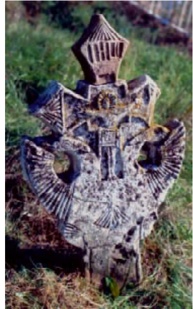
Рис. 2 Кам'яний ромбічний хрест з розп'яттям і візантійським орлом. с. Михайлівка. Миколаївська обл. Кінець XIX ст.