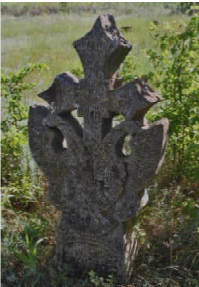
Рис. 7 Кам'яний хрест з візантійським орлом.с. Балацьке. Миколаївська обл. Початок XIX ст.