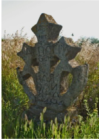
Рис. 6 Кам'яний хрест з візантійським орлом.с. Себіно. Миколаївська обл. Середина XIX ст.