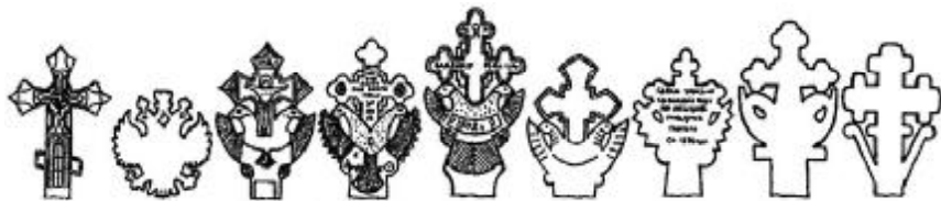
Рис. 9 Схематизовані зображення генези та еволюції форм кам'яного хреста з візантійським орлом. ХІХ-ХХ ст.

Найдавнішим трилистим хрестом з візантійським орлом, що зберігся в Україні, є кам'яний надгробок поч. ХІХ ст. з Михайлівки (Миколаївська обл.); це трираменний, витесаний з місцевого жовтого вапняку, хрест, бокові роги якого підпирають голови рельєфного орла. Зубцюваті крила розкинуті таким чином, що торкаються дзьобів птаха. Офактурені прямими лініями пухирці мають означати лапи хижака, бо знаходяться там, де починаються його крила. Як віяло сприймається довгий хвіст. Середохрестя виділено пластично, а також відповідним словосіченням. Інший надгробок з Михайлівки такого самого типу (1876 рік) зроблений за іншою мірою; порушені пропорції хреста, спрямлені форми птаха, стерті рельєфи та контурні лінії його проробки. Зате силуетно не програв самий надгробок. Потужної сили мистецька енергія, магічна таїна внутрішньої форми, зокрема у прорізах кам'яної брили, сформованих рухами голів, ший та крил орла. Не менш виразними є зазубні на крилах, бокові підпухлості – лапи. Остаточо сакралізує надгробок різьблений текст-епітафія; висота пам'ятника – 1,4 метра.