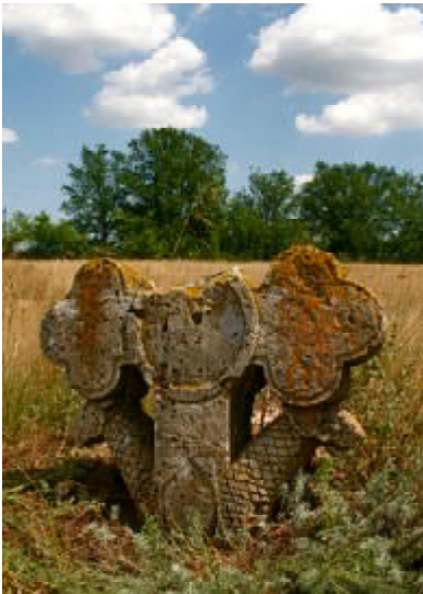
Рис. 3 Кам'яний хрест з візантійським орлом. с. Ракове. Миколаївська обл. Початок XIX ст.