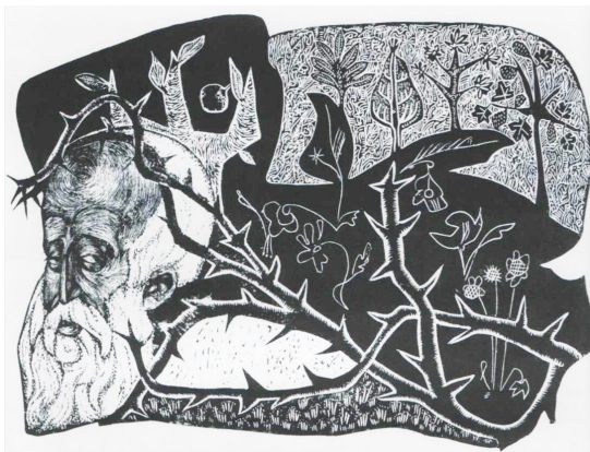
Ілюстрація до поеми Івана Франка «Мойсей». «Буду зайцю служити гніздом». 1967, лінорит

У наступному часі робота над франкіаною тривала, хоча це були, здебільшого, автономні композиції, які лише доповнювали вже існуючі тематичні групи. А вже 2005 року в творчості Є. Безніска відбулася надзвичайна подія: в епіцентрі його мислення знову опинився «Мойсей». Але навряд чи повсталі у вкрай короткому часі 27 пастельних аркуші могли хоч чимось нагадувати створений майже сорок років тому ліногравюрний цикл. За цей немалий відрізок життя змінилася й Україна, й сам «формат особистості» Євгена Безніска – одного з провідних сучасних митців, графіка з особливою творчо-універсальною репутацією. Відтак змінилася й сама творча установка художника, який у подальших пошуках відповідей на великі питання історії, релігії і моралі знайшов змогу побувати в біблійних місцях.