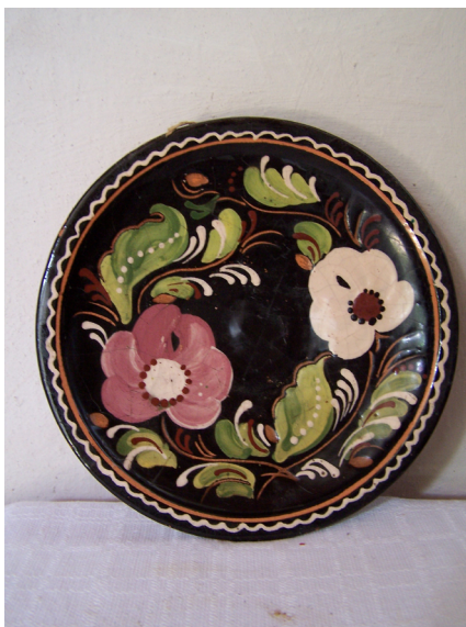
Зразки закарпатської кераміки, які демонструють різноманітність напрямків декорування, починаючи від стародавніх часів до минулого століття