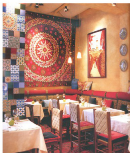
рис.2 "Мускат" г. Москва