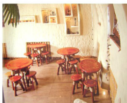
рис.3 "Кофе- бар"