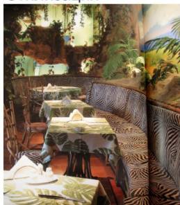
рис.1 "Крузо" г. Москва