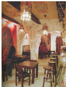
рис.4 "Кофеин" г. Харьков