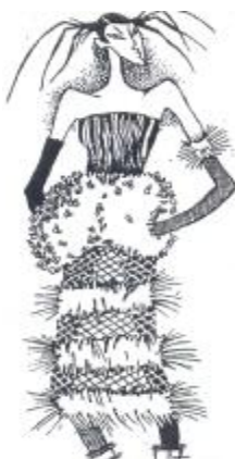
Мал. 4. Ескіз костюма-образа