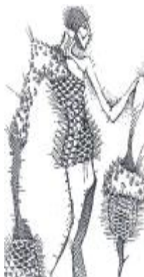
Мал. 2. Образно-асоціативне проектування