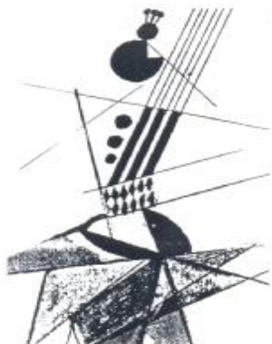
Мал. 1. Абстрактно-асоціативне проектування