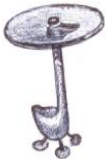
Мал. 5 А. Мендіні. Столик «Sirfo»