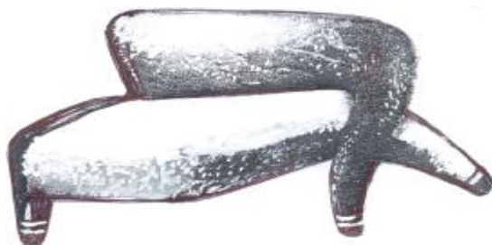
Мал. 6. Н. Коутес. Диван «Golleggio»