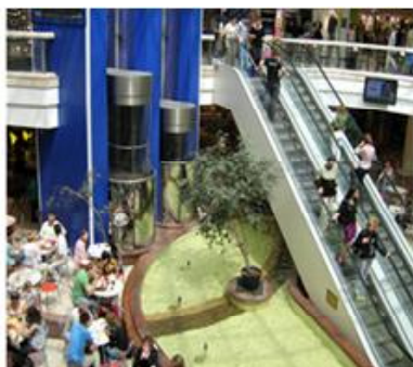
Декоративний басейн у ТЦ «Глобус» (Київ)