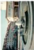
Фонтан на території міської ради (Львів-Франківськ)