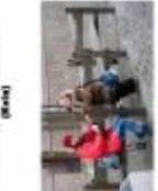
Лавка біля урні у центрі Львів-Франківськ