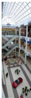
Фонтан в атриумі ТРЦ у Дніпропетровську