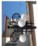
Ліхтарі біля історичного аркусу на вул. Лаврівська