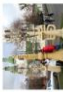
Декоративна урні у центрі Львів-Франківськ