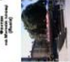
Фонтан у центрі Львів-Франківськ