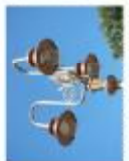
Ліхтарі на території міської ради (Львів-Франківськ) на вул. Володимирська, 12