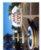
Фонтан перед Музеєм історії Тернопільщини і Галичини (Житомир, Івано-Франківська обл.)