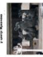
Ліхтарі-скульптури у центрі Львів-Франківськ на вул. Бруцкиської (Львів)