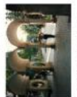
Вхідна група до парку у центрі Львів-Франківськ