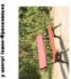
Лавка біля історичного аркусу (Львів-Франківськ)