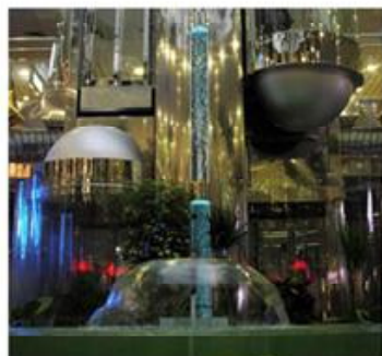
Фонтан у підземному ТЦ «Метроград» (Київ)