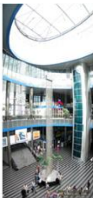
Декоративний водоспад на Південному залізничному вокзалі (Київ)