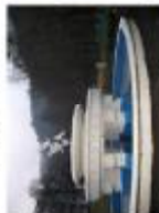
Фонтан на території професійного ліцею (Львівська, Закарпатська обл.)