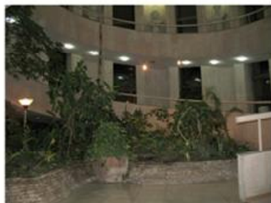
Зимовий сад і пандус у холі Національної бібліотеки України імені В.І.Вернадського