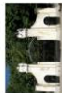
Вхід до парку історичного району (Львів-Франківськ)