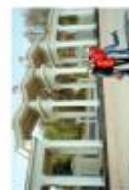
Вхідна група до парку історичного району (Львів-Франківськ) на вул. Володимирська (Львів)