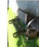
Лавка в урні у центрі Львів-Франківськ