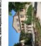
Фонтан у професійному ліцею (Закарпатська обл., Івано-Франківська обл.)