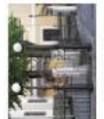
Спортивий майданчик (Львів-Франківськ)