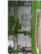
Лавка на історичній вулиці (Львів)