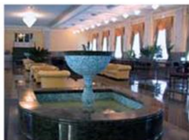
Фонтан на II поверсі Сервіс-центру. Зала чекання Харківського залізничного вокзалу