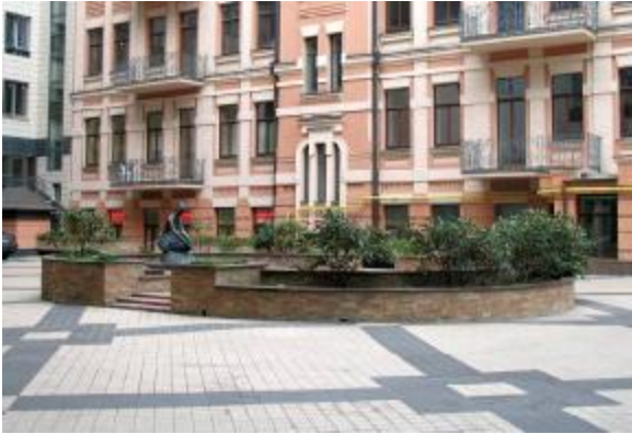
1 – Декоративна композиція по вул. Велика Житомирська, 20 (Київ)

Виходячи з цих міркувань, можна виділити кілька особливостей поліфункціональних малих архітектурних форм . Однією з них є вигідно представити те чи інше місце будь-якого середовища, куточок ландшафту, максимально наповнити його змістом і практичним застосуванням, глибокою ідейністю творчої думки дизайнера. Другою особливістю, власне, і є можливість поєднання кількох (до п'яти і більше) функцій в одному об'єкті дизайну,