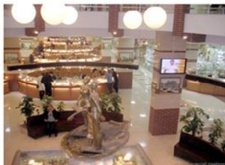
Декоративна група у холі ТЦ «Новый привоз» (Одеса)