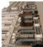
Ліхтарі на вул. Лаврівська