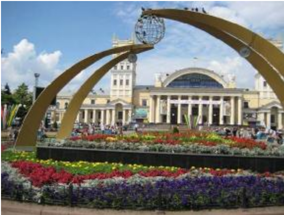
2 – Декоративна композиція з квітниками на Привокзальній площі у Харкові

Рис.2. Поліфункціональні малі архітектурні форми