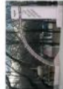
Вхідна група до адміністративного корпусу (Львів)