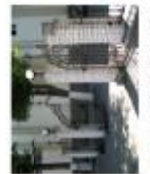
Центральний вхід до спортивної зали (Львів-Франківськ)