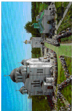
Рис. 3. Розташування прочан на території Полотського Спасо-Єфросинівського монастиря. День пам'яті пророка подібної Єфросинії