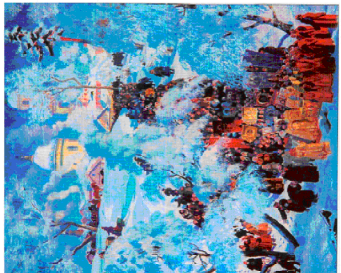
Рис. 2. Картина Б. Кустодієва “Хресний хід в селі” (1915)