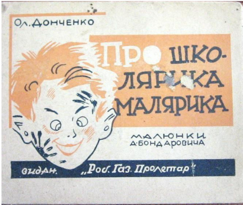
О. Донченко «Про школярика-малярика» (книжка-ширмочка, додаток до журналу «Жовтень», 1928, №9) – обкладинка