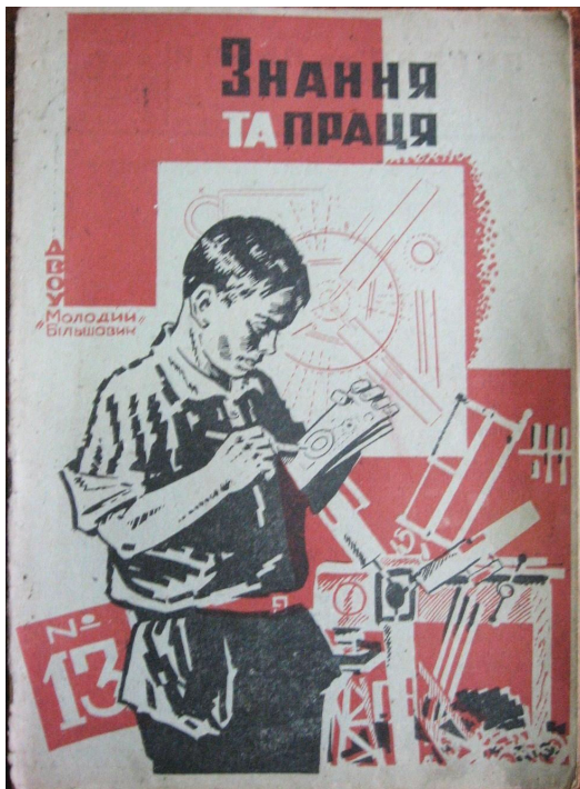
Обкладинка журналу «Знання та праця» (Харків) – №13.