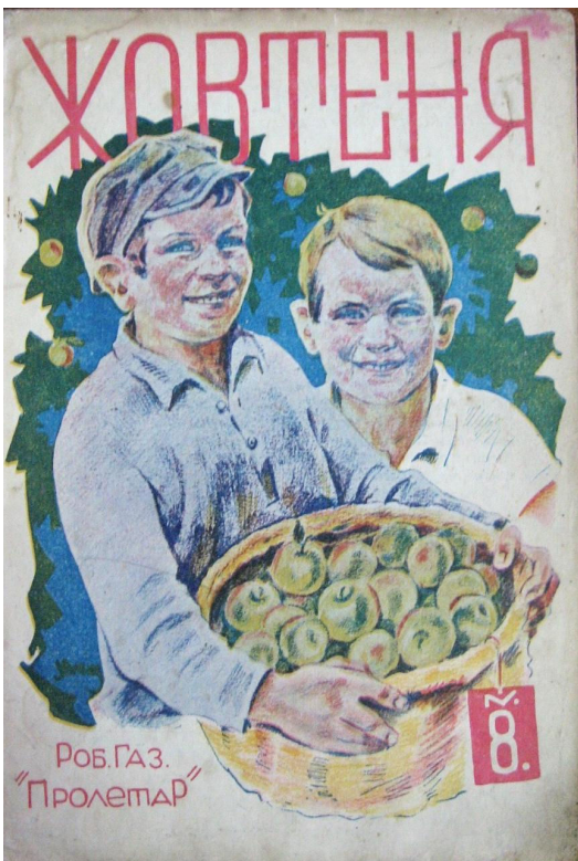
Обкладинка журналу «Жовтень», 1929, №8 («З яблуками»)