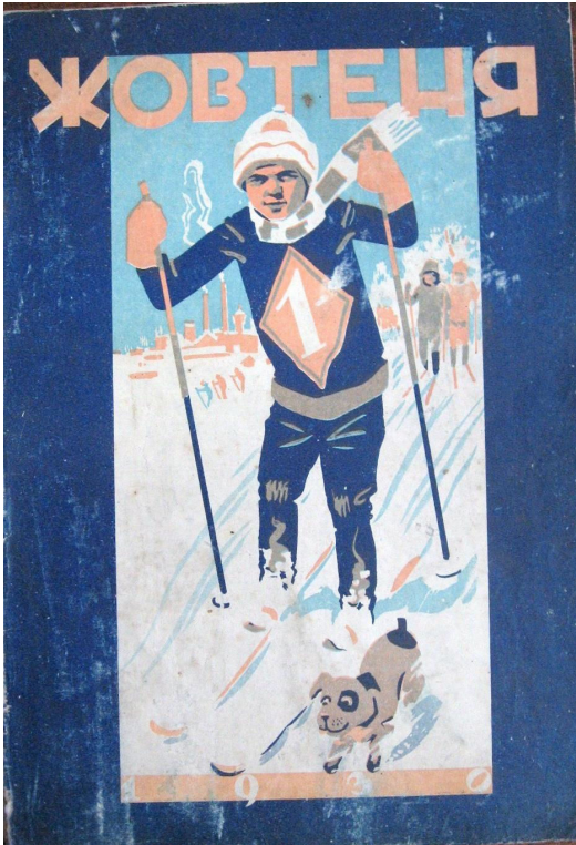
Обкладинка журналу «Жовтень», 1930, №1