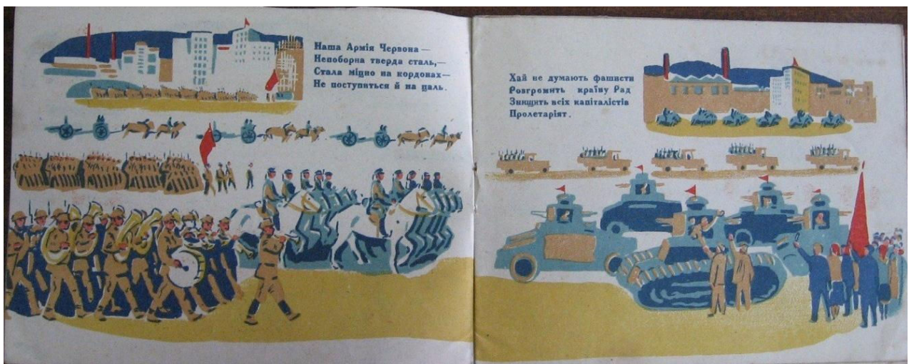
О. Слісаренко «Святкуймо п'ятнадцятий Жовтень» (Х., Молодий більшовик, 1932) – розворот