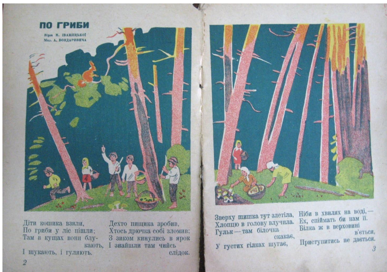
М. Іваницька «По гриби» — розворот журналу «Тук- тук», 1930, №9 (липень)