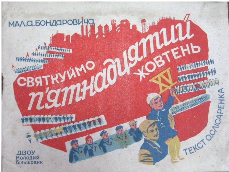
О. Слісаренко «Святкуймо п'ятнадцятий Жовтень» (Х., Молодий більшовик, 1932) – обкладинка