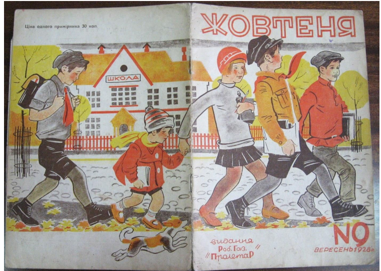
Обкладинка журналу «Жовтень», 1928, №9