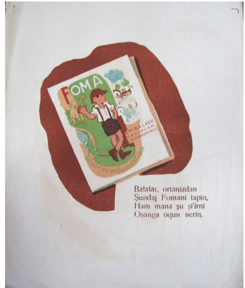
С. Михалков «Фома» (узбецькою мовою).- Ташкент., 1938. – кінцівка