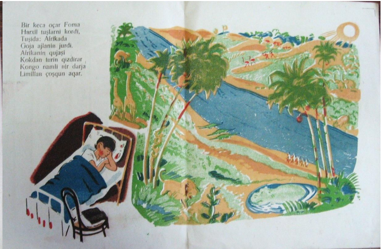
С. Михалков «Фома» (узбецькою мовою).- Ташкент., 1938. – розворот