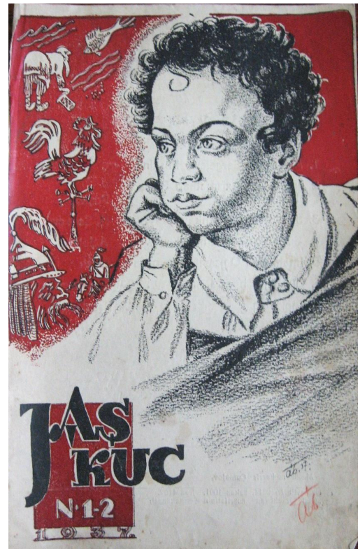
Обкладинка узбецького дитячого журналу – випуск, присвячений 100-річчю смерті О. Пушкіна (1937, №1-2).