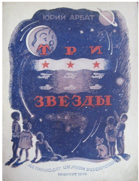
Ю. Арбат «Три звезды», Ташкент., 1940. – обкладинка