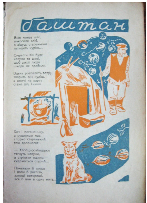
Т. Хоткевич «Бахтан» – сторінка журналу «Жовтень», 1929, №8.