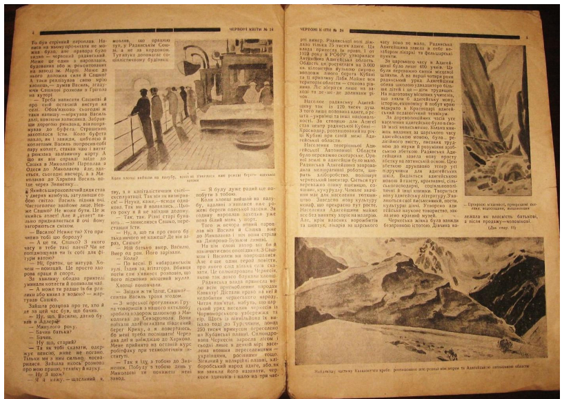
Ілюстрації до повісті Г. Юнга «Хмереч» – розворот журналу «Червоні квіти» (Харків), грудень 1930 р. (№24).