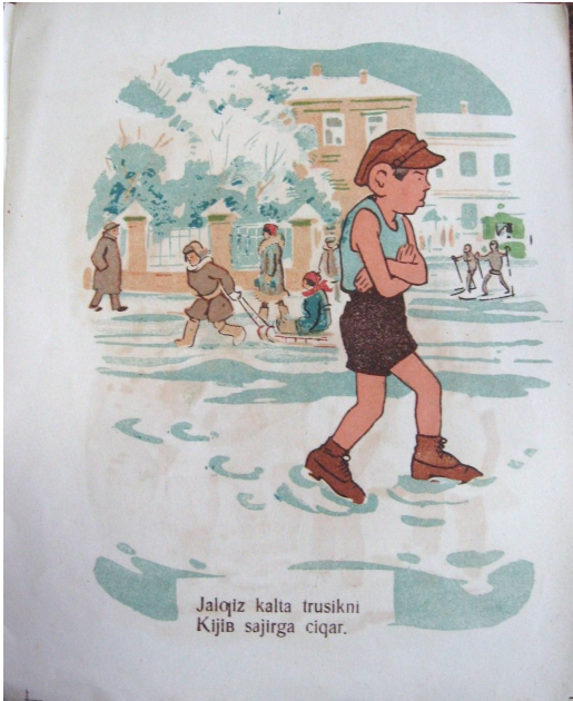
С. Михалков «Фома» (узбецькою мовою).- Ташкент., 1938. – сторінкова ілюстрація