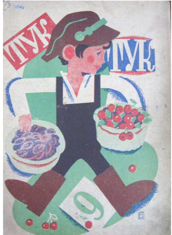
Обкладинка журналу «Тук-тук», 1930, №9 (липень)