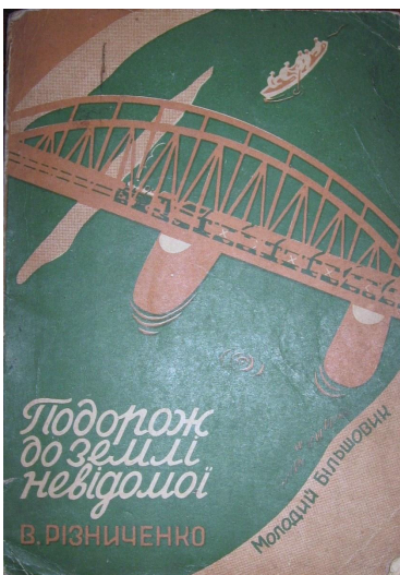
Обкладинка книги В. Різниченка «Подорож до землі невідомої» (Харків, Одеса.: Молодий більшовик., 1932)