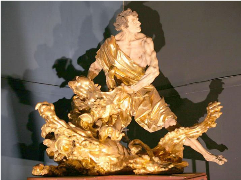
Рис.1 Твори І.Пінзеля: Самсон розриває пащу лева