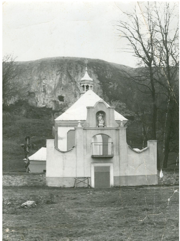
Рис.3. Вхідна брама зпоміщеною в ній скульптурою св. Онуфрія (фото поч.1990-х років)