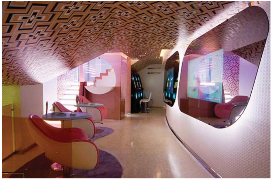
Рис. 1. Ігровий зал «Mozzart простору» в центрі Белгорода [8]