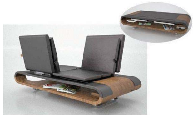
Рис.2. Диван-комп'ютерний столик. Брендон Аллен