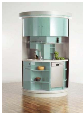
Рис.9. Кухня-шафа, фірма Contrast Concepts.