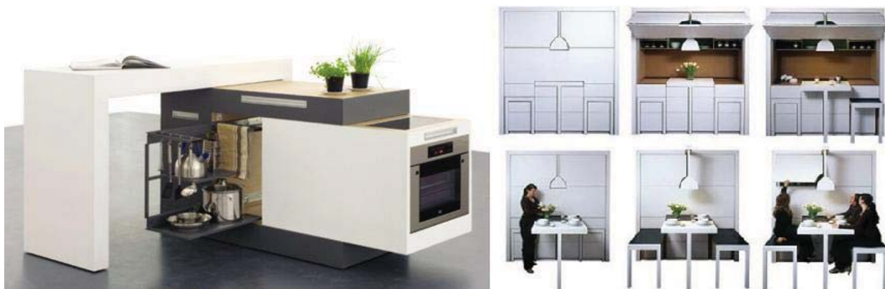
Рис.7. Кухні-шафи, що займають мінімум простору