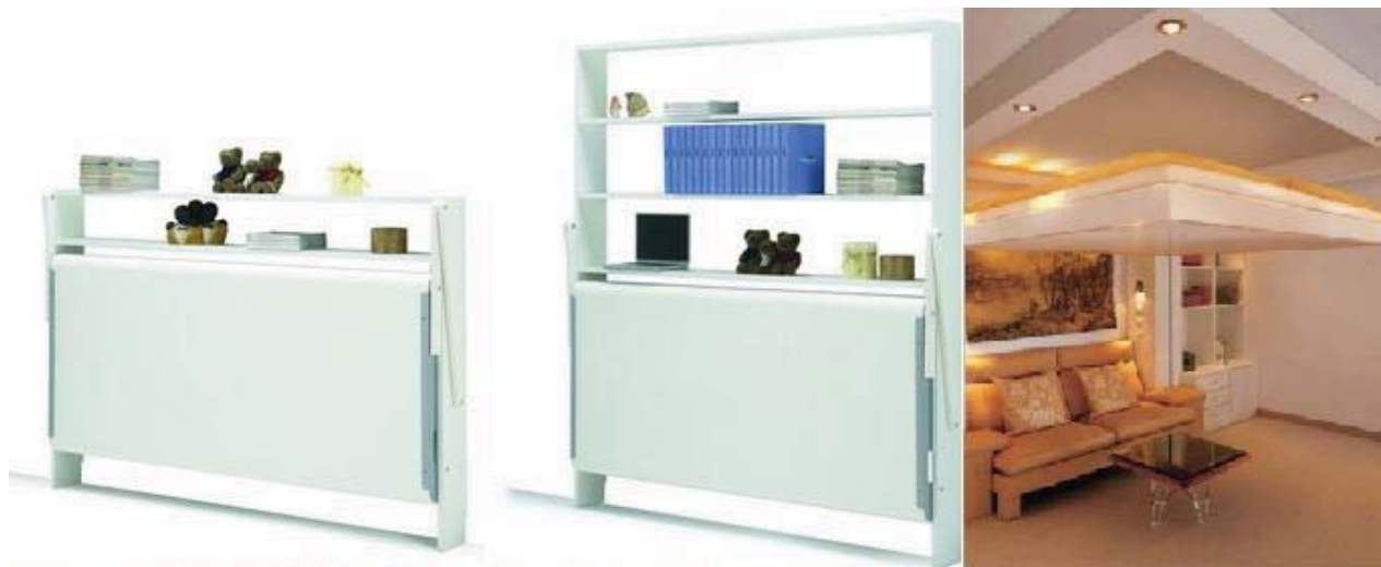
Рис.3. Ліжко-поліця, фірма "Leo" та ліжко під стелею