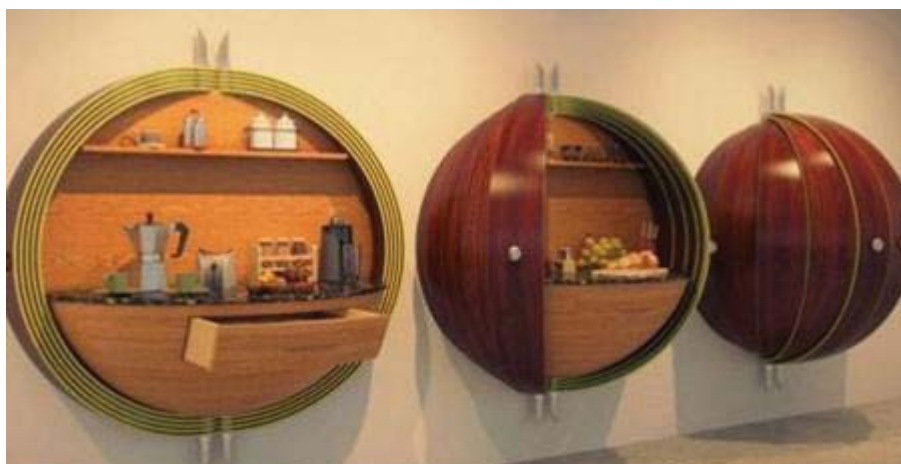
Рис.8. Компактна кухня-гніздечко, фірма Dime Kitchen