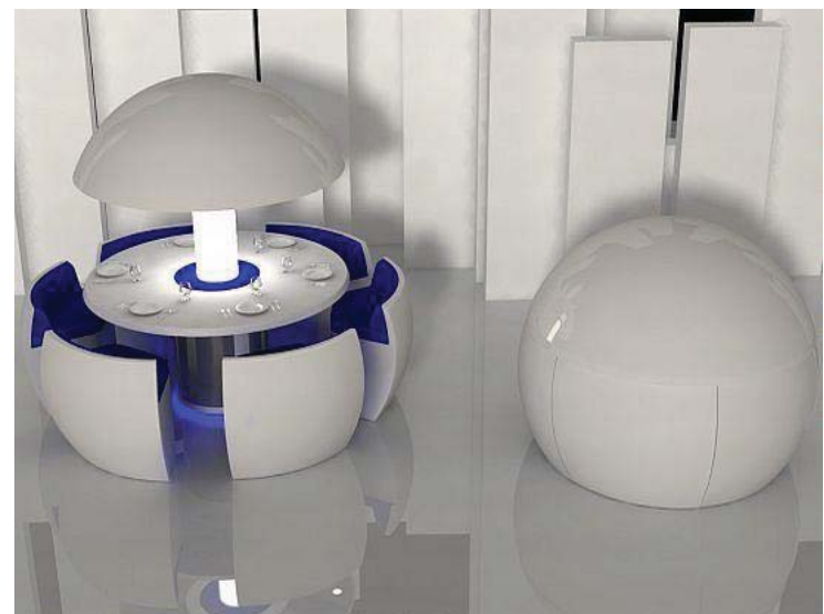
Рис.5. Стіл Kure – Сфера. Fatih Can Sarioz