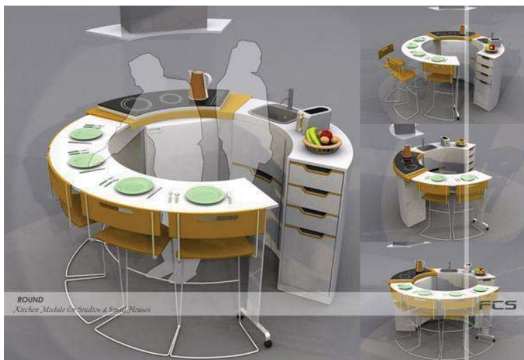
Рис.6. Обідній стіл-трансформер з робочою поверхнею. Fatih Can Sarioz