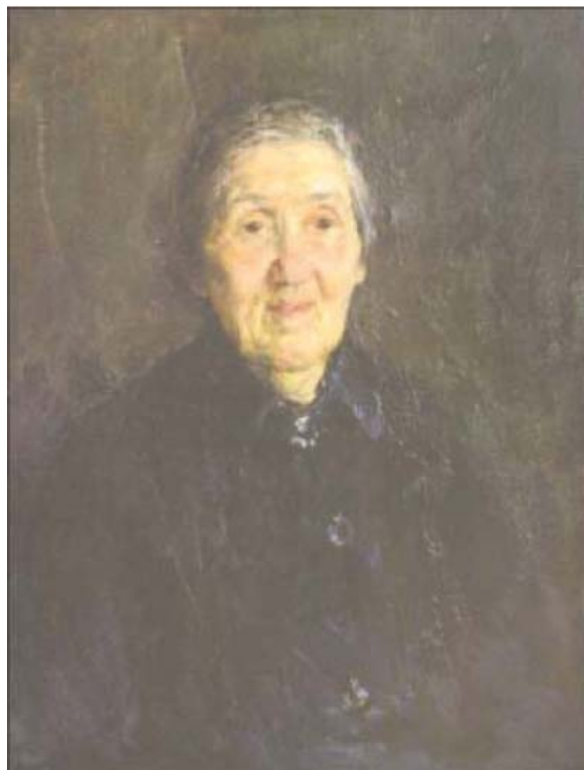
«Портрет матери» х/м 70-60 1961 г.