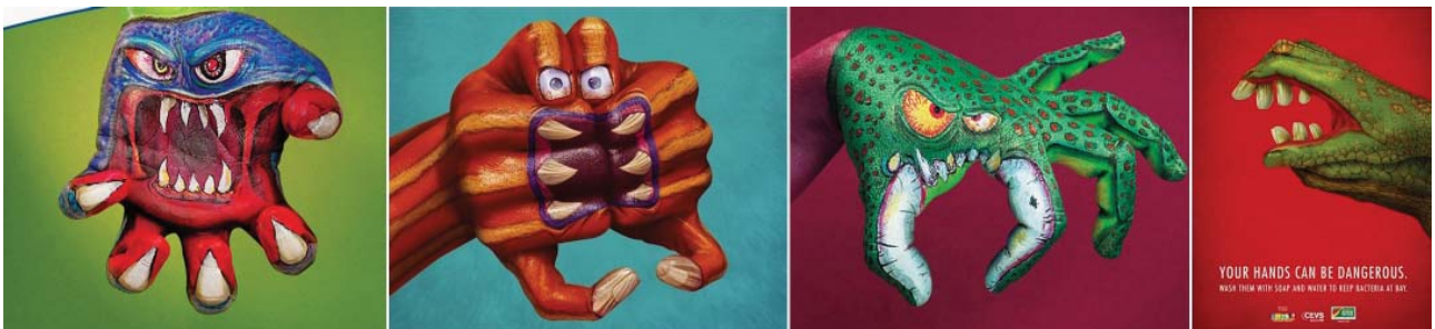
Рис. 5. «Антимікробна» рекламна кампанія Kimberly-Clark Professional.