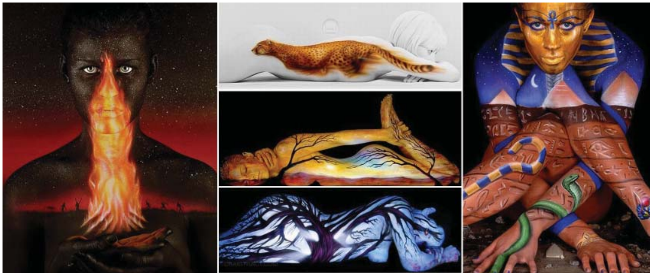
Рис. 2. Боді-пейнтінг Крейга Трейсі.