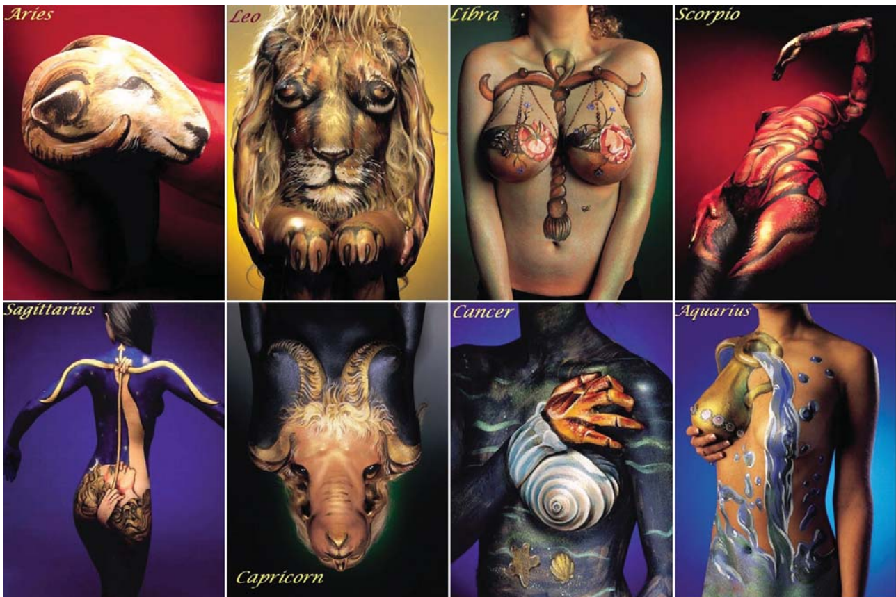
Рис. 7. Знаки зодіаку Руді Евертса.

для маніпулювання. <...> Художник розглядає своє тіло позаіндивідуально, зовсім його не культивує та і перетворюючи на об'єкт» [3, с. 230].