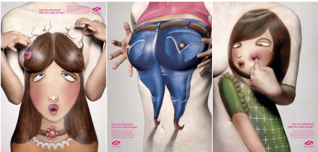
Рис. 6. Соціальна рекламна кампанія «Чи на тих речах ти заціклюєшся?»

виснажливі вправи, палили на собі волосся; Р. Шварцкоглер (Австрія) по шматочку відрізає власну плоть, фіксуючи все на фотоплівку; В. Аккончі (США) кусав себе в плече і демонстрував укуси глядачам; К. Бьорден (США) у виставковому залі змусив свого друга вистрілити у нього так, щоби злегка задіти руку (в результаті чого був серйозно поранений), а в