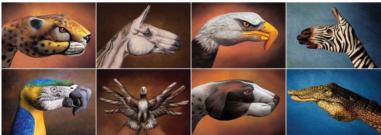
Рис. 3. «Ручні тварини» Гвідо Даніеле.

основа нашої розмальовки. Ми прикрашаємо життя і проповідуємо – тому ми розмальовуємось» [1, с. 115].