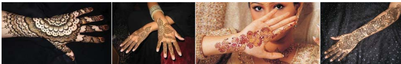
Рис. 1. Менді – розпис хною.