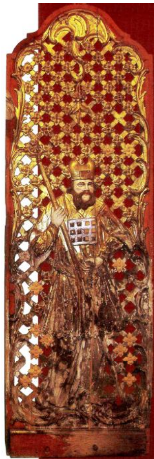
Ил. 16. Аарон. Служебные двери иконостаса. 1765–1767 гг. Дерево, резьба, роспись. Львовская галерея искусств