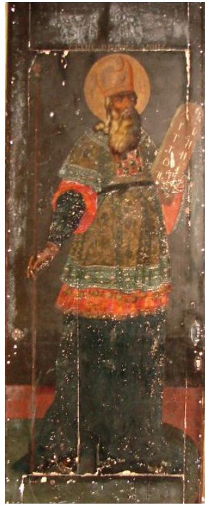
Ил. 12. Аарон. Северные служебные двери. XVIII в.