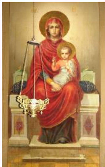
Ил. 4. Богоматерь с Младенцем. Нач. XX в.