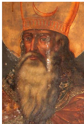
Ил. 15. Мельхиседек. Фрагмент