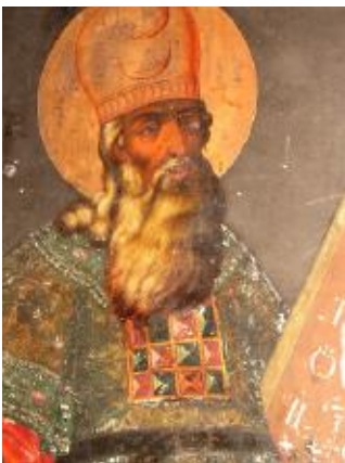
Ил. 14. Аарон. Фрагмент