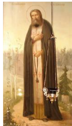
Ил. 6. Преподобный Серафим Саровский. Нач. XX в.