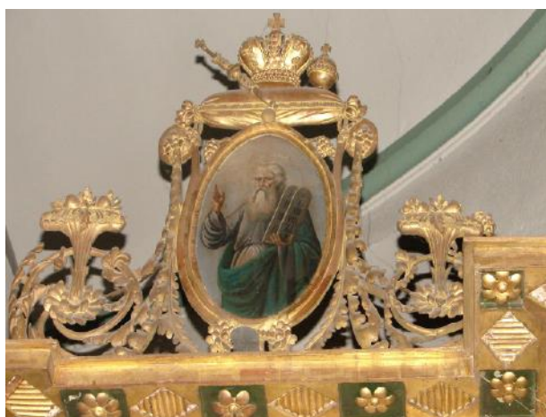
Ил. 9. Моисей. Картуш над южной служебной дверью. Нач. XIX в.