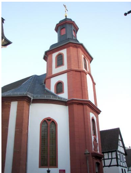
Ил. 1. Церковь свт. Иннокентия Иркутского и св. преподобного Серафима Саровского (бывшая Reinhardtskirche). Арх. Х. Герман. 1732–1733 гг.