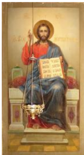
Ил. 5. Иисус Христос. Нач. XX в.