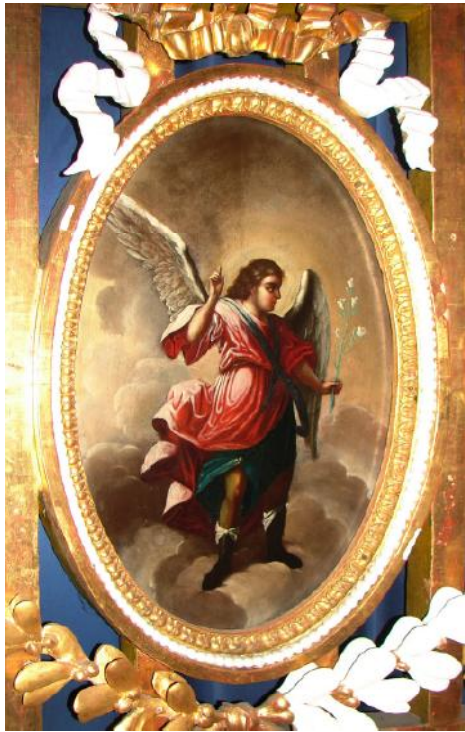
Ил. 10. Архангел Гавриил. Благовещение. Царские Врата. Нач. XIX в.