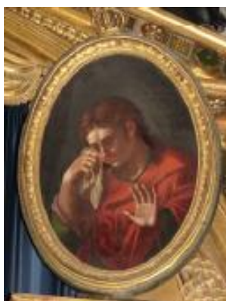
Ил. 8. Апостол Иоанн. Картуш над Царскими Вратами. Нач. XIX в.