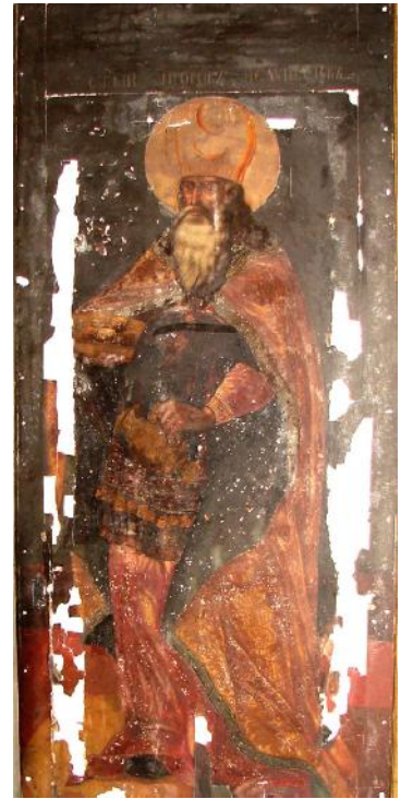
Ил. 13. Мельхиседек. Южные служебные двери. XVIII в.