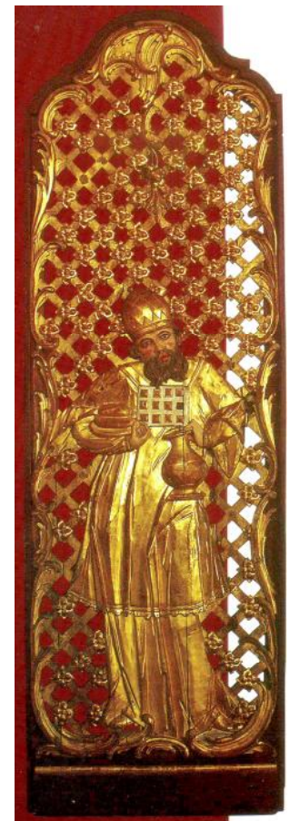
Ил. 17. Мельхиседек. Служебные двери иконостаса. 1765–1767 гг. Дерево, резьба, роспись. Национальный музей им. А. Шептицкого, Львов