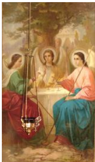
Ил. 3. Ветхозаветная Троица. Нач. XX в.