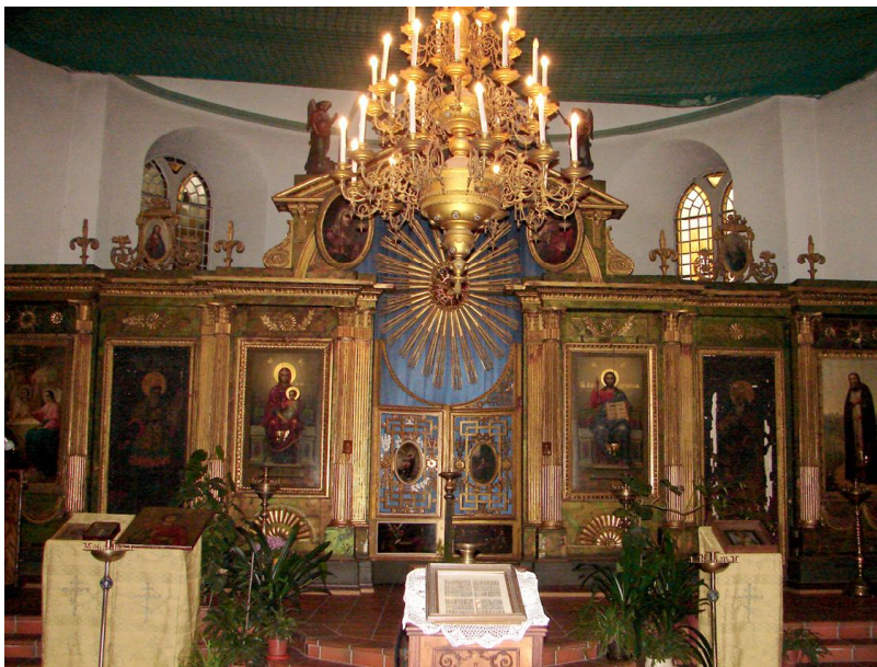
Ил. 2. Иконостас. 1805 г.