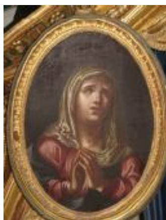
Ил. 7. Богоматерь. Картуш над Царскими Вратами. Нач. XIX в.