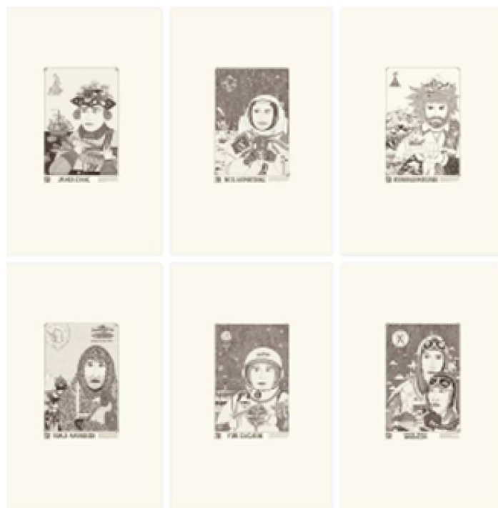
Рис.1. Хорошок Е., дипломний проект спеціаліста, серія плакатів «The One», 2011 р., кер. І. Яковець, С. Деркач