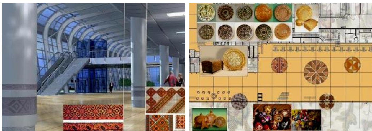
Рис. 2. Проект нового терміналу міжнародного аеропорту «Львів»: а – інтер'єр і елементи використаних на колонах орнаментів; б – план підлоги 1-го поверху і підбір мотивів писанки для мозаїки.