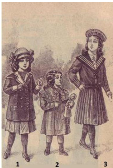
Рис. 1. Дитячий костюм 1912 р.