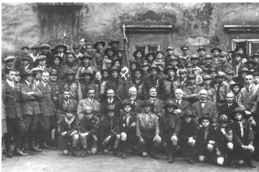
Рис. 6. Уніформа членів пластової організації 1921 р.