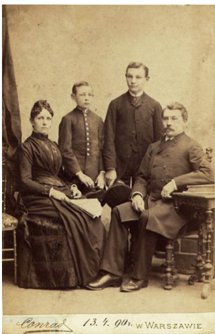
Рис. 2. Мундир гімназиста (зліва). 1890 р.