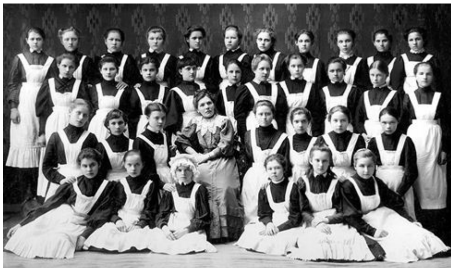
Рис. 4. Уніформа гімназисток поч. XX ст.