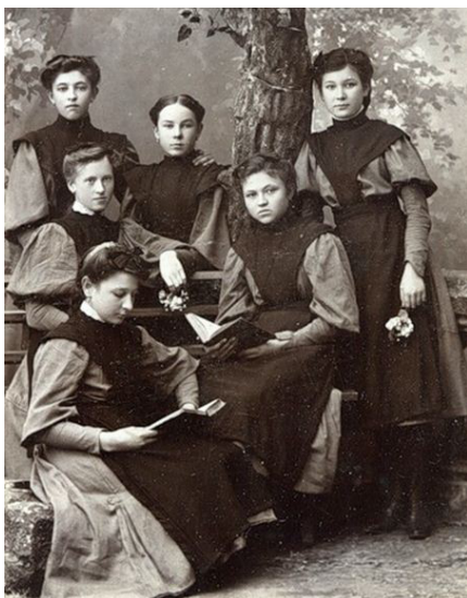
Рис. 3. Гімназистки до 1910 р.