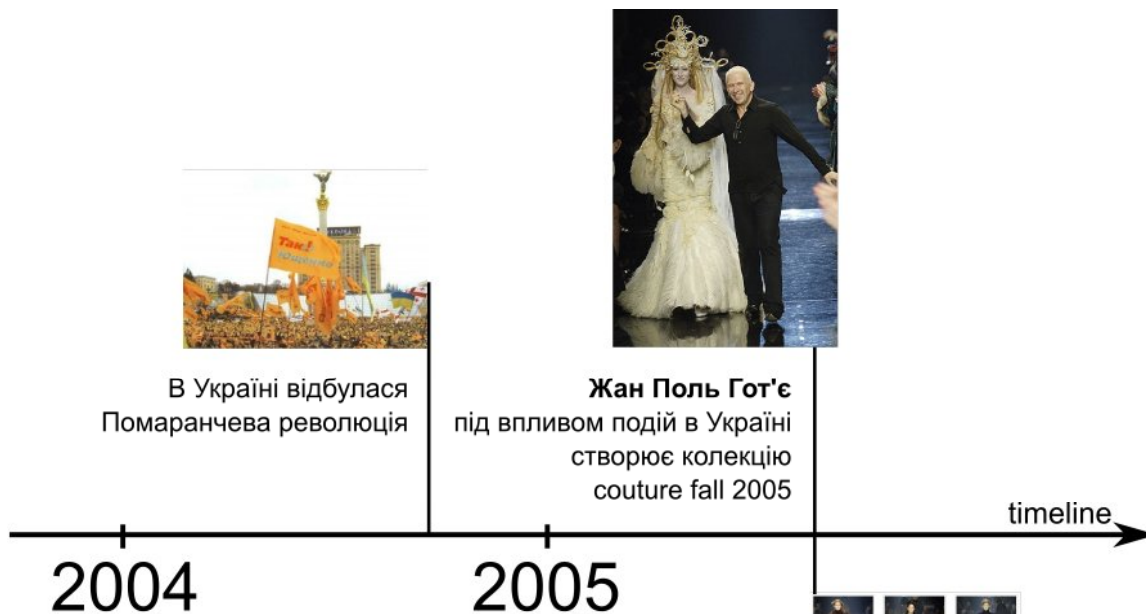
рис. 2 Фрагмент хронологічно-матричної моделі еволюції форм костюму XXI ст., Косенко О.І.