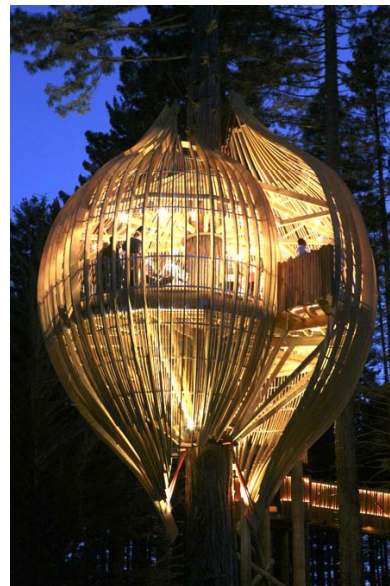
Yellow Treehouse Restaurant © 2009, Pacific Environments Architects, New Zealand