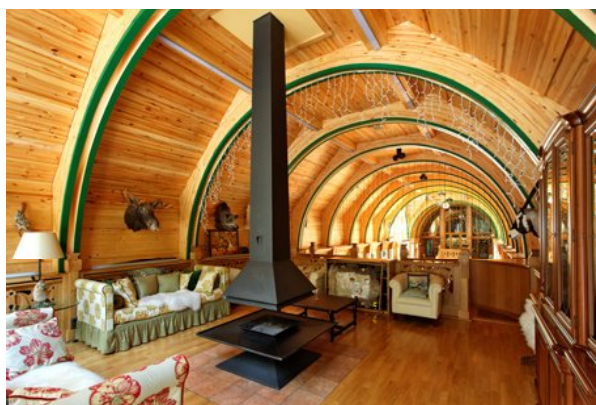
Ресторан в поселке Жуковка © 2009, Олег Карлсон, Александр Куликов, АСБ «Карлсон и К», Россия