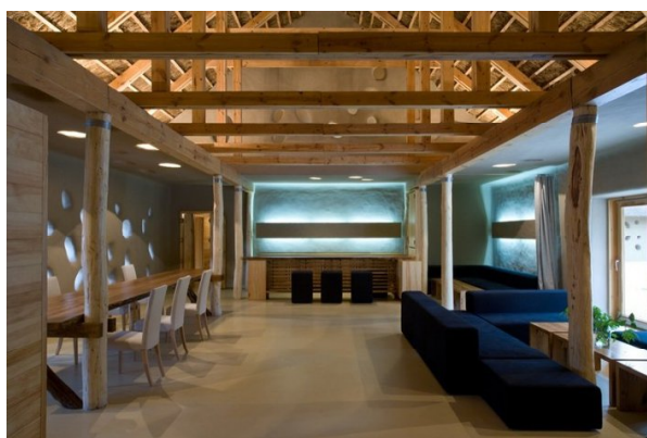
Мини-отель под Днепропетровском FriendHouse или "ДРУГОЙ Дом.Ресторан."