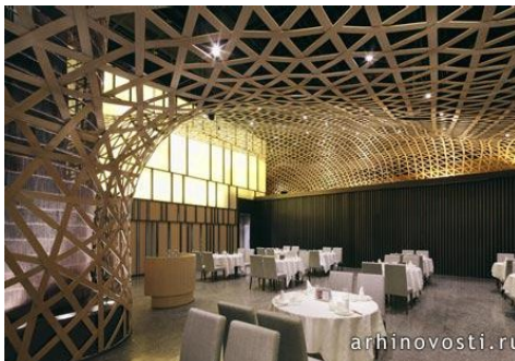
Ресторан Дворец Тан (Tang Palace) от ЭфСиДжейЗет (FCJZ). Ханчжоу, Китай.