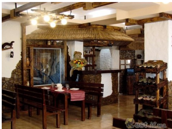
Ресторан "Витребеньки" м. Івано-Франківськ