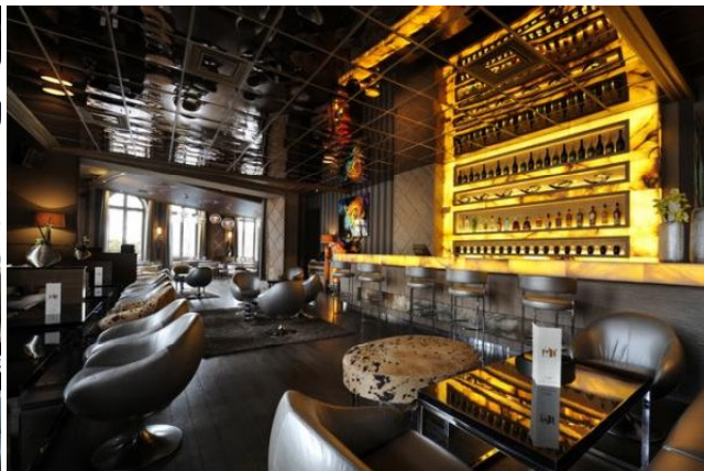
Клуб-ресторан L'Arc в Париже изменен Cannes-based Prospect Design.

деякі просунуті громадяни вирішили створити власний, «екологічно чистий» світ в рамках свого будинку, звільнивши його від усілякого хіміко-фізичного сміття. Але актуальним залишається питання екологічності публічних місць. Наприклад місць громадського харчування, ресторанів. Основним аспектом екологічного дизайну є використання лише натуральних, екологічно чистих матеріалів. У останньому еко-дизайн не обмежений жодними рамками.