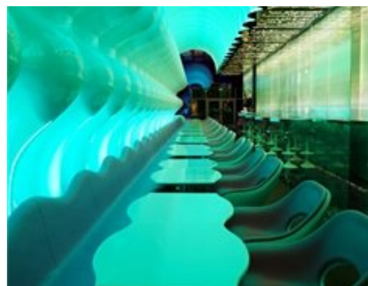
«Switch». Ресторан – «Хамелеон» в Дубаи