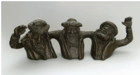
11. Ники Инбер. Три поющих еврея. Вторая половина XX в. Бронза, литье. Выс. 20