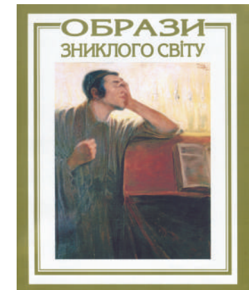
2. Каталог львовской выставки «Образы исчезнувшего мира» (кураторы В. Сусак и Г. Глембоцкая). 2003. Презентация выставки в галерее «АВЭЖ». 2004