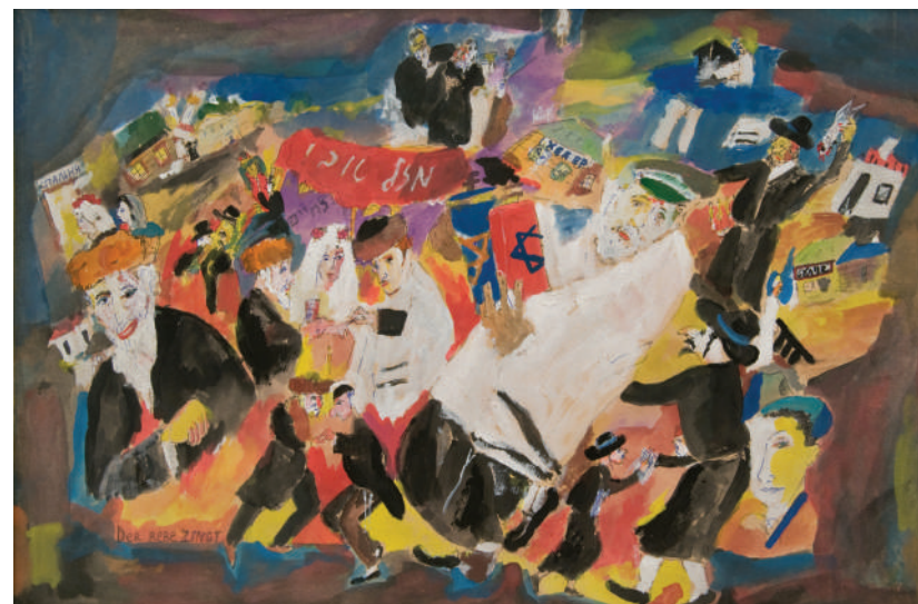
7. Марк Шагал. Колено Леви. (Из цикла «Иерусалимские витражи»). 1962. Бумага литография. 33х23.5