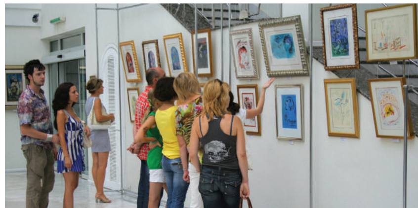
7. Фоторепортаж выставки «Шедевры мирового искусства. Парижская школа». Июль 2010 (продолжение)

ской выставки, ставшим не только зрительским центром, но и идейным фокусом всей экспозиции, было монументальное полотно поляка Станислава Фабьянского «Еврейский погром в Киеве в ноябре 1905 г.» (1906).