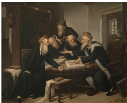
1. Карл Шлейхер. Толкователи Талמודа (Спор). Вторая половина XIX в. Картон, масло. 25.7х32.