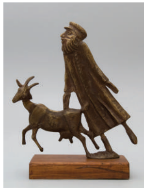
10. Леонид Зильбер. Еврей с козой. Вторая половина XX в. Бронза, литье. Выс. 36