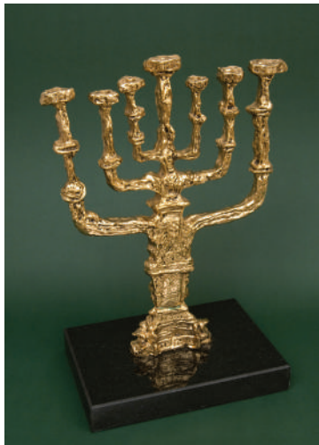
12. Сальвадор Дали. Золотая Менора. 1980. Бронза, литье, золочение. Выс. 45 13 Амедео Модильяни. Голова. 1910-е. Бронза, литье. Выс. 49

оставшемуся в произведениях искусства и памяти народа миру еврейского местечка, который стал сегодня мифологемой еврейского идиллического Бытия. Несмотря на социальный трагизм и погромы, в сознании наших современников еврейский штетл навсегда остался запечатлен как компактный еврейский микрокосм и колыбель нынешней еврейской цивилизации, потерянный для евреев Рай 7 . Мы воспринимаем его как в реальном, так и былинном времени и пространстве, где жизнь евреев была цельной и патриархальной, простой и трогательно наивной, и одновременно проникнутой хасидской мистикой и вековым укладом, насыщенной подлинно еврейскими ценностями. Еврейское местечко стало источником вдохновения для целой генерации художников-евреев эпохи модернизма, соединив воедино законы и традиции Торы, еврейское фольклорное наследие и художественный авангард.