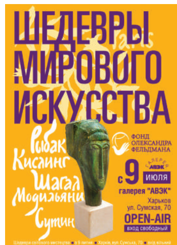
6. Афиша выставки «Шедевры мирового искусства. Парижская школа». 2010