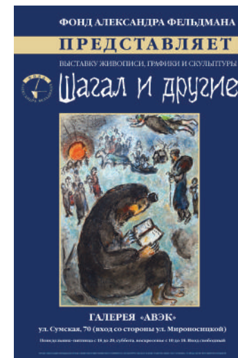
3. Афиша выставки «Шагал и другие. Иудаика в изобразительном искусстве конца XIX — XX вв.». 2007