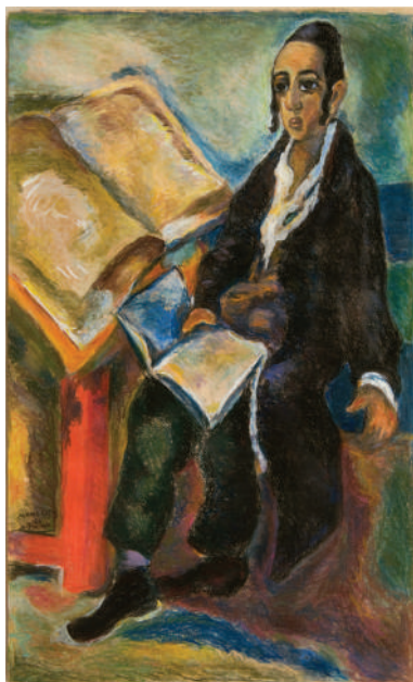
3. Мане-Кац. Ученик иешивы. 1926. Бумага, пастель. 64х39