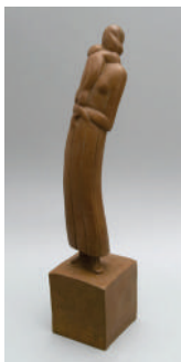
14. Хана Орлова. Материнство. 1914. Бронза, литье. Выс. 55