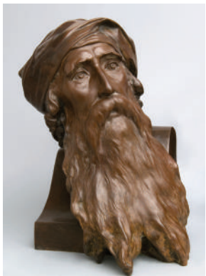
8. Пауль Ковальчевски. Моисей. Конец XIX — начало XX в. Бронза, литье. Выс. 39