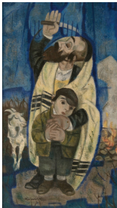
2. Артур Кольник. Жертвоприношение Исаака. 1950-е. Картон, масло. 55х30