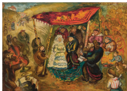
4. Иссахар-Бер Рыбак. Еврейская свадьба. 1930-е. Холст, масло. 15.5х22