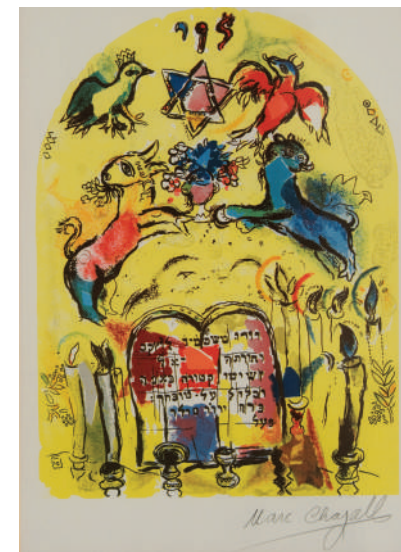
6. Соломон Гершов. Из цикла «Праздники». Бумага, смешанная техника. 26х36