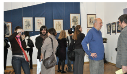
3. Открытие выставки