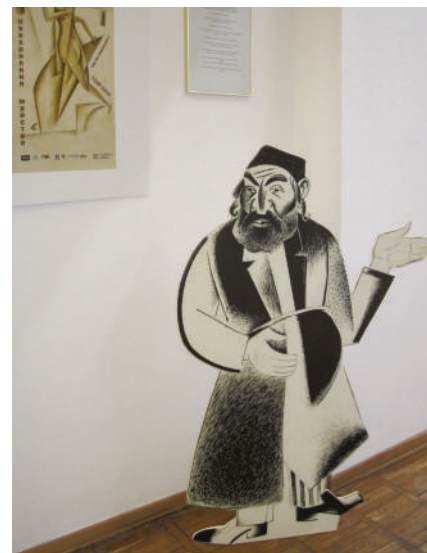
1. Начало экспозиции