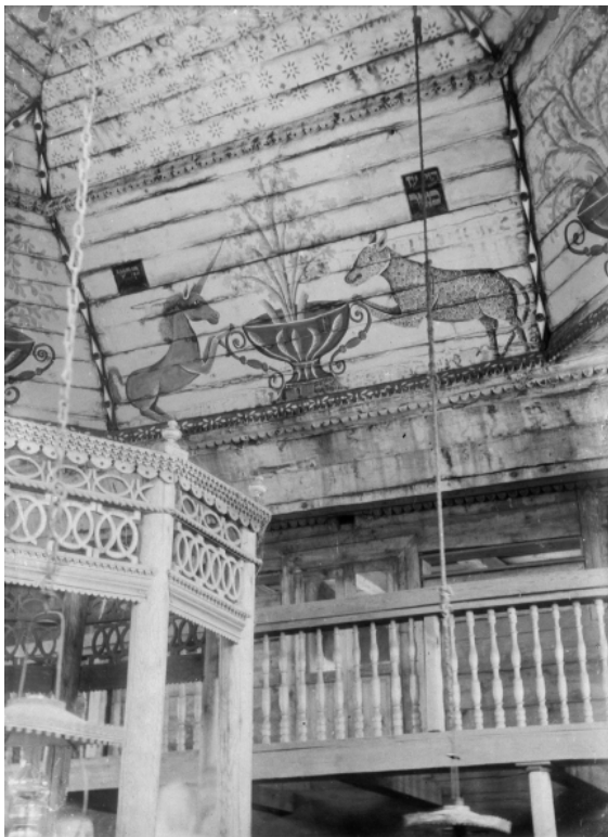
Рис. 5. Нсринск. Житомирская обл. Деревянная синагога. XIX в. Фрагмент росписи. Фото Ф. Вовка, 1907 г. (ИА НАНУ. Фонд Ф.К. Вовка. Д. 253. Ед. хр. 7).