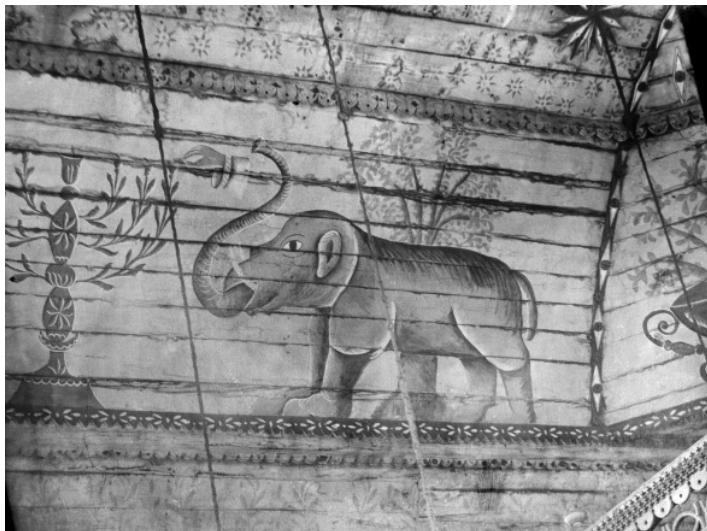
Рис. 6. Нсринск. Житомирская обл. Деревянная синагога. XIX в. Фрагмент росписи. Фото Ф. Вовка, 1907 г. (ИА НАНУ. Фонд Ф.К. Вовка. Д. 253. Ед. хр. 1).