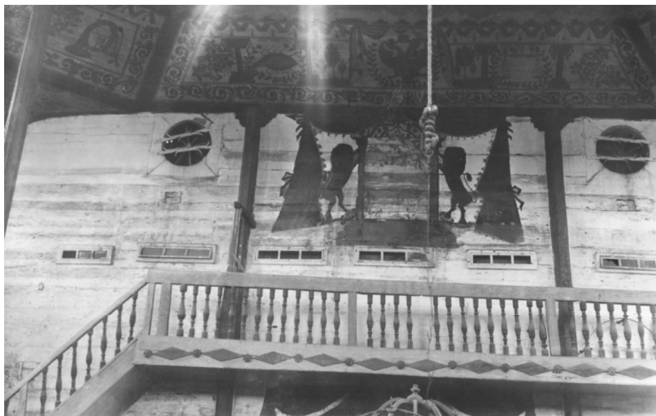
Рис. 10. Новомиргород (Златополь). Кировоградская обл. Деревянная синагога, XVIII – XIX вв. Вид на хоры и проемы в женскую галерею. Фото 1933-1935 гг.