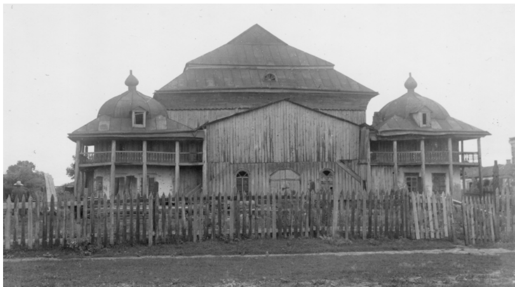
Рис. 4. Новомиргород (Златополь). Кировоградская обл. Деревянная синагога, XVIII – XIX вв. Вид на западный фасад. Фото 1933- 1935 гг.

простая, даже грубоватая отделка тесом и изысканная резьба арон коदेशа , амуда , а также оригинальная для синагогальной традиции роспись восточной стены 9 .