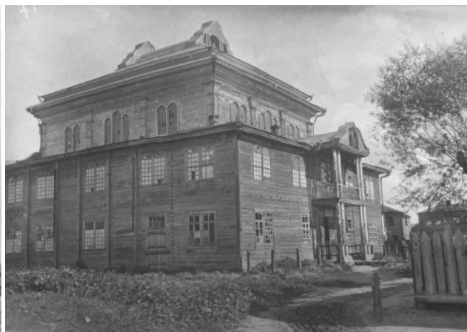
Рис. 2. Чернобыль. Киевская обл. Деревянная синагога. Вторая половина XX в. Общий вид с северо-запада. Фото П. Жолтовского, 1929 г. (Институт рукописи НБУ им. В.И. Вернадского. Фонд С. Таранушенко, № 278. Д. 499. Ед. хр. 367).

при чем, людям надлежало содержать цадика, чтобы он, как святой человек мог посвятить себя общению с Богом [1, с. 123]. В этот период также отмечается определенная лояльность властей к хасидскому движению, которое, начиная с 1804 г. – времени принятия известного «Положения о евреях» в Российской империи с правом различных еврейских религиозных групп строить свои синагоги и назначать своих духовных лидеров, было началом легализации хасидизма [1, с. 108]. После бегства в конце 1930-х гг. ружинского цадика в Австрию и установление повсеместного влияния в этом регионе чернобыльских (тверских) хасидов и их потомков, создается по сути надобщинная организация основной массы еврейского населения, которые стали последователями этого течения в хасидизме. Хотя российская власть и пыталась контролировать жизнь и влияние цади́ков, их реальное религиозное и социально-экономическое влияние на евреев оказалось чрезвычайно сильным.