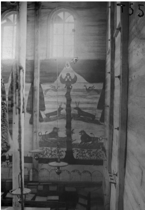
Рис. 9. Тальное. Черкаска обл. Деревянная синагога. 1860-е гг. Фрагмент росписи восточной стены. Фото Д. Щербаковского, до 1909 г. (ИА. Ф.9. Д.73. Ед.хр. 55 (5)).

Из элементов живописной иерархии можно только отметить роспись западной стены: двуглавого орла в триумфальном окружении ветвей и портьеры по центру зодиакального пояса, а под ним, на стене двух стоящих львов, поддерживающих написанный архитектурно-орнаментальный портал, и вписанных в раздвинутую портьеру, подобно другим, оформлявшим весь зал. Резные объекты и элементы оформления синагоги – арон-