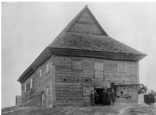
Рис. 1. Нсринск. Житомирская обл. Деревянная синагога. XIX в. Вид на западный фасад.