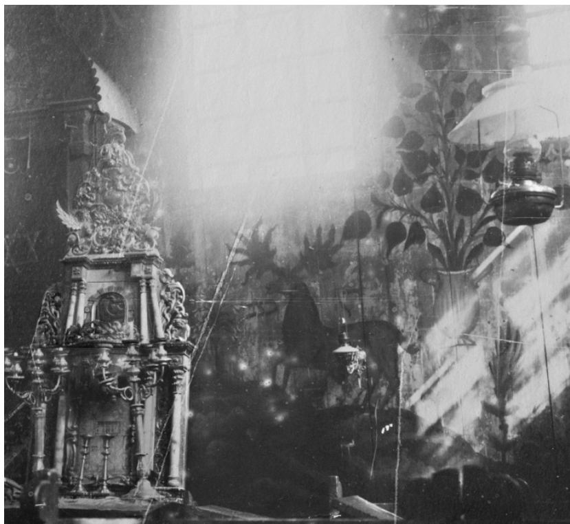
Рис. 11. Уланов. Винницькая обл. Деревянная синагога. XIX в. Восточная стена с арон-кодешем и фрагментом росписи. Фото Д. Щербаковского, 1920-е гг. (ИА. Ф.9. Д.73. Ед.хр. 182 (49)).

аспекты бытования этого ушедшего пласта художественной культуры.