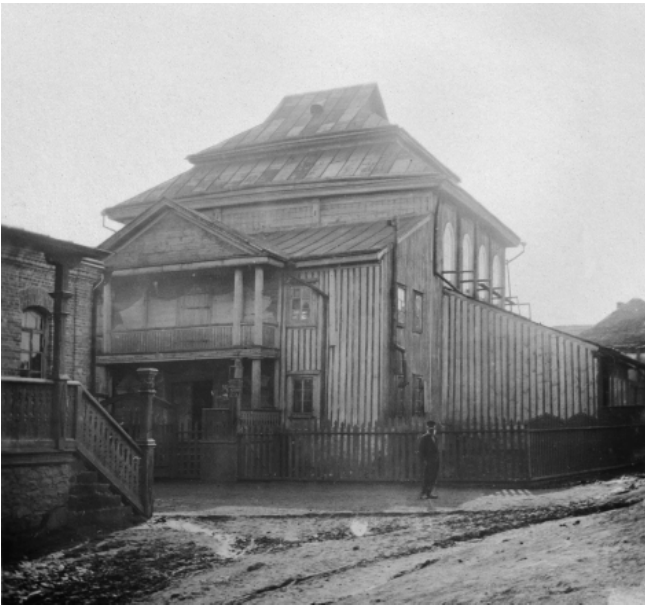
Рис. 3. Тальное. Черкасская обл. Деревянная синагога. 1860-е гг. Вид на западный фасад. Фото Д. Щербаковского, до 1909 г. (ИА НАНУ. Фонд Д. Щербаковского, № 9. Д. 73. Ед.хр. 57 (4)).

гать, что в большинстве их присутствовали скромные декорации – отдельные изобразительные мотивы на восточной стене и потолке, что было характерно для этого периода (Уланов, Погребеще). Были синагоги и вовсе без росписей (Животов), что говорит в пользу того, что живописный декор в поздний период уже не был частью обязательной программы. Возможно, это обусловило и оскуднение всей декорации, где, как уже подчеркивалось, из сплошной, ковровой росписи остаются лишь избранные сюжеты.