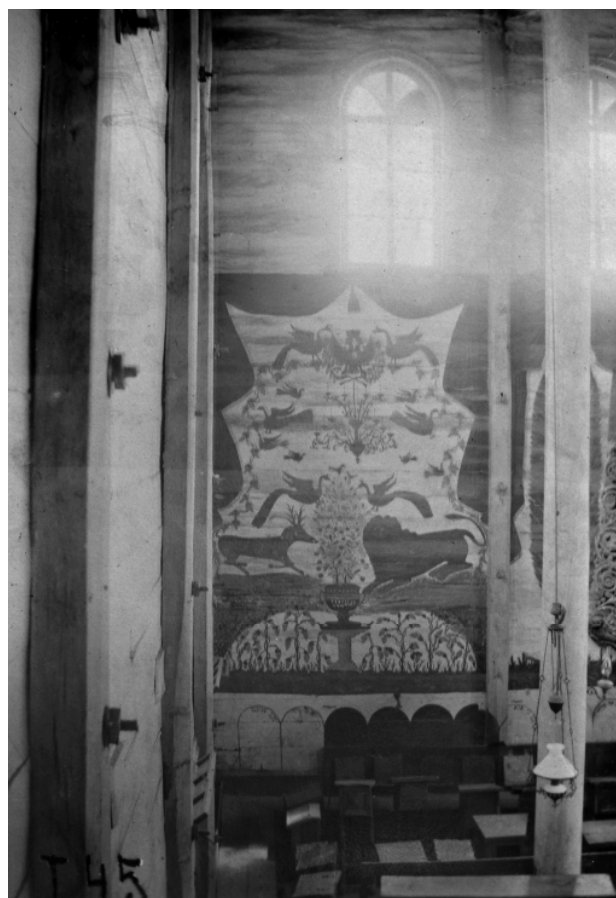
Рис. 8. Тальное. Черкасская обл. Деревянная синагога. 1860-е гг. Фрагмент росписи восточной стены. Фото Д. Щербаковского, до 1909 г. (ИА. Ф.9. Д.73. Ед.хр. 45 (47)).