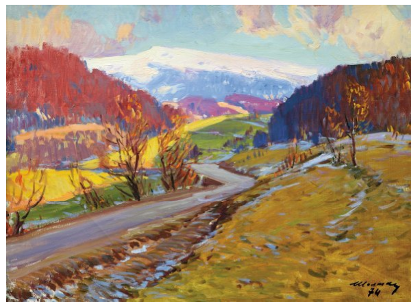
2. «Полонина Руна» (1974),