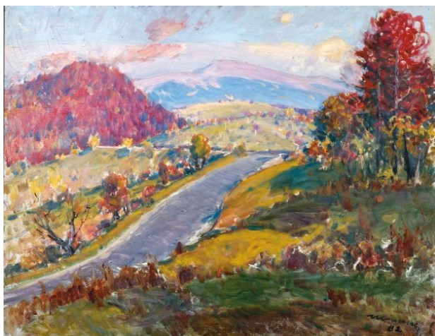
3. «Дорога в гори» (1983),