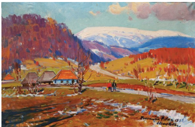
1. «Полонина Рівна» (1972),