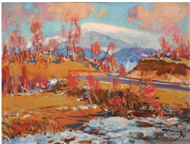
5. «Полонина Руна» (1985),