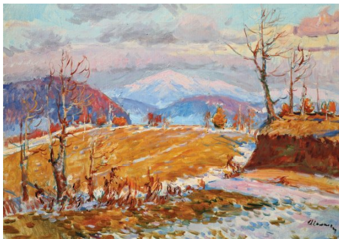
6. «Полонина Рівна» (1985).

священника (від якого змушений був відмовитись у 1947 р.), що без сумніву вплинуло на світовідчуття художника, наповнило його новим «духовним диханням», додало емоційної наснаги. Це час його визнання на державному рівні (у 1975 р. митець був удостоєний звання Заслуженого художника України). Загалом, час творчої зрілості митця. Золтан Шолтес не шукає шляхів виділитись, не зраджує творчому методу, лише утврджує, підсумовує випрацьовану роками власну мистецьку програму.