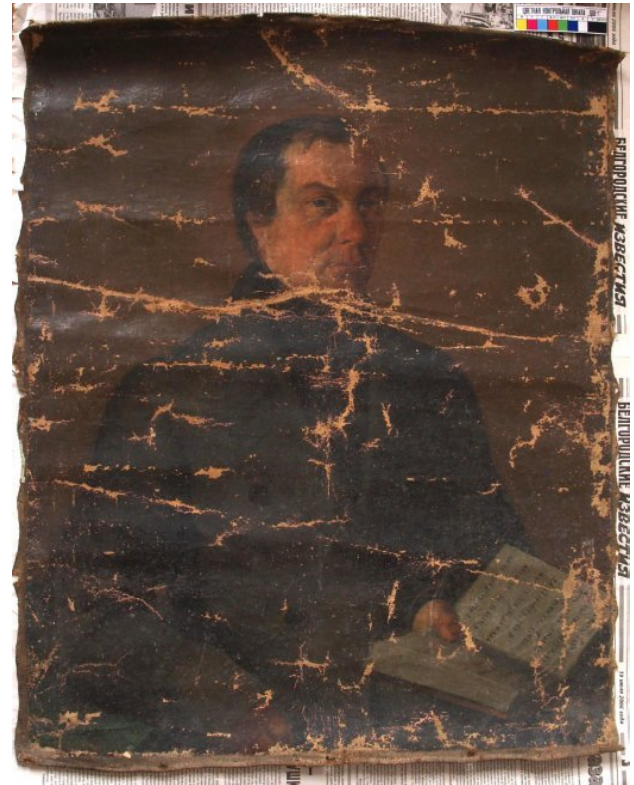
«Чоловічий портрет» Ігнат'єв П.І. сер. ХІХ ст

звучить як: «...в руки врагъ егъ» – тут маються на увазі мислені вороги [1].