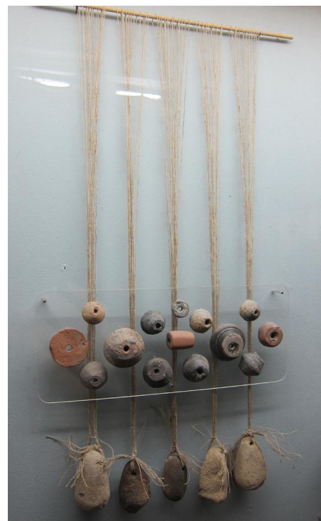
Рис.7. Ткацьке спорядження – прясельця і грузила. (Експозиція ХОКМ)