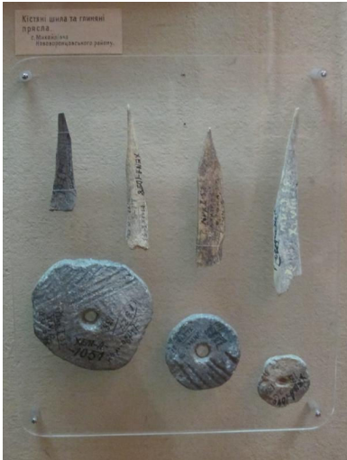
Рис. 1. Кістяні шила і глиняні прясла для виготовлення пряжі з Михайлівського поселення. (Експозиція ХОКМ)