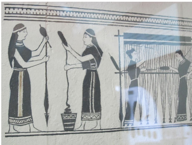
Рис.6. Копія розпису старогрецької вази