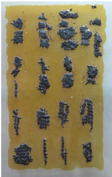
Рис. 2. Залишки тканин полотняного переплетення, с. Каїри. (Експозиція ХОКМ)