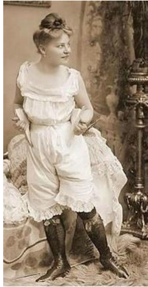
Комплект нижнего белья, состоящий из рубахи, заправленной в панталоны и чулок