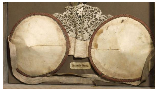
Один из первых бюстгалтеров XX века

С 1932 года усилия конструкторов сосредоточились на форме чашки, которую стали кроить отдельно. В 1935-м компания Maidenform стала вшивать в чашечки бюстгалтера специальные вкладки и придавать таким образом дополнительный объем женской груди. В это время была введена нумерация чашек от А до D. Постепенно появились более детальные расчеты — бюстгалтеры начали подразделяться по полноте и по объему [6].