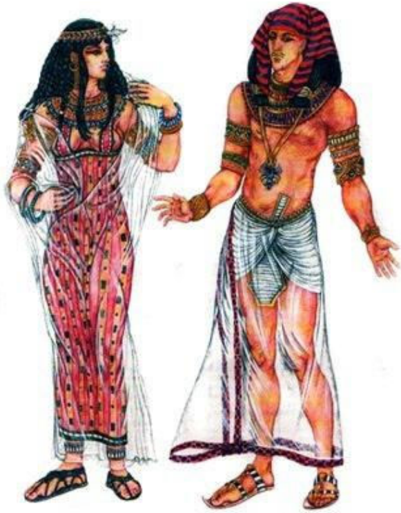
Женское платье – калазирис Набедренная повязка – схенти