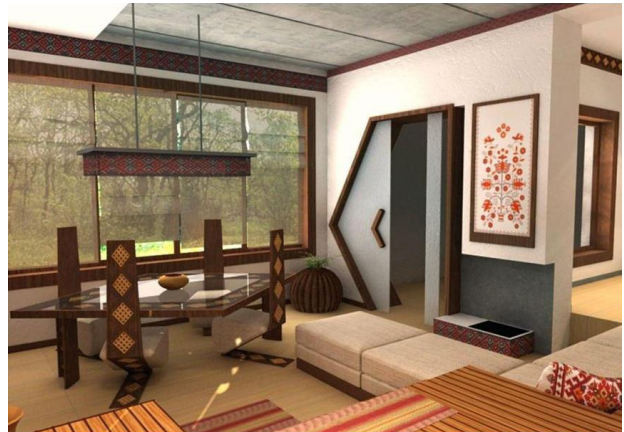
Рис.2. Дизайн сучасного інтер'єру з врахуванням національних рис (Південь)

Запропоновано художньо-графічні варіанти сучасного житла в межах традиційних планувально-композиційних рішень (Рис. 1а; 2а), і з врахуванням національних рис та ознак визначених регіонів України (зокрема, Поділля та Південь). Також спроектовано національно-спрямований житловий інтер'єр, не обмежуючись типовою планувальною схемою, а використовуючи формальне приміщення сучасного житлового будинку. (Рис.1б; 2б) Зваживши вимоги до проекту, спираючись на принципи дизайну, представ-