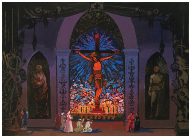
3–6. Батий Г.И. «Тарас Бульба». Эскизы к опере. Картон, гуашь. 1998 – 1999 гг.