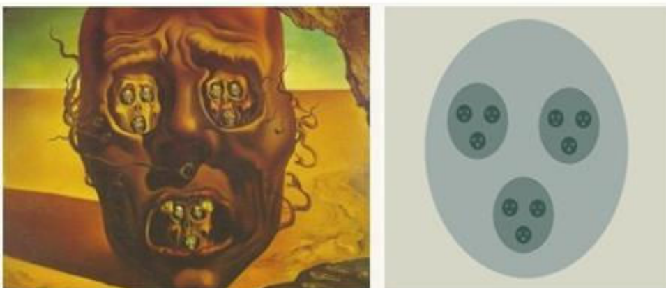
Рис.4. Фрактал в сучасному мистецтві. Зліва: Dali, Visage of War, 1940; Зправа: фрактальна Канторова множина (Cantor dust).