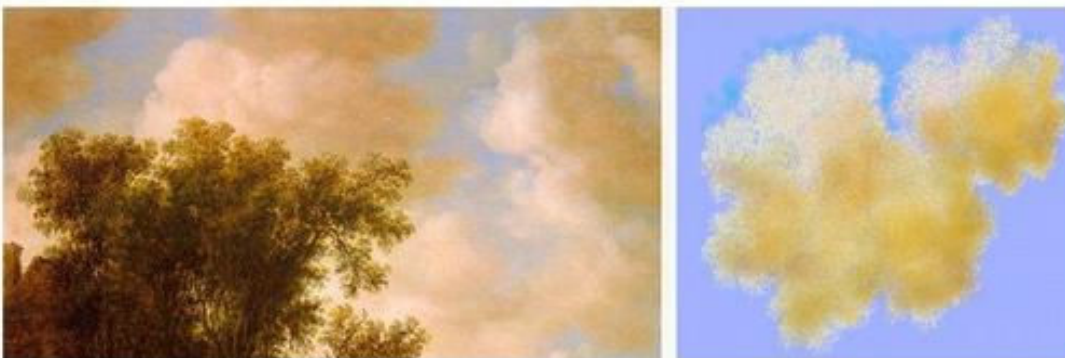
Рис. 3. Хмари: Зліва – Ян Гойєн фрагмент картини, 1655; Зправа – Хмара створена у Iterated Function