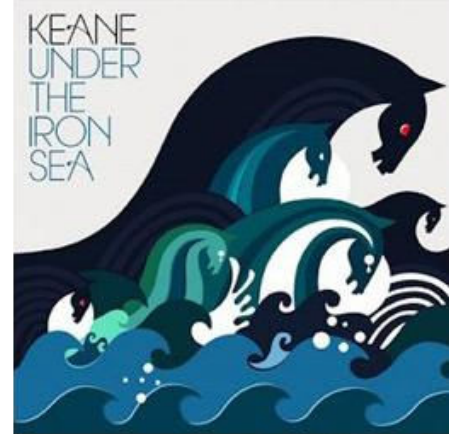
Рис. 5. Обкладинка альбому рок-групи Keane "Under the Iron Sea"