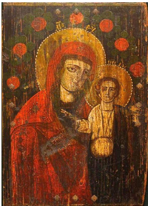
Гл. 13. Ікона, «Богородиця з дитям». Дерево, олія. Розмір 29 x 39 см. XIX ст. Київське Полісся. Приватна колекція «Українського професійного банку»