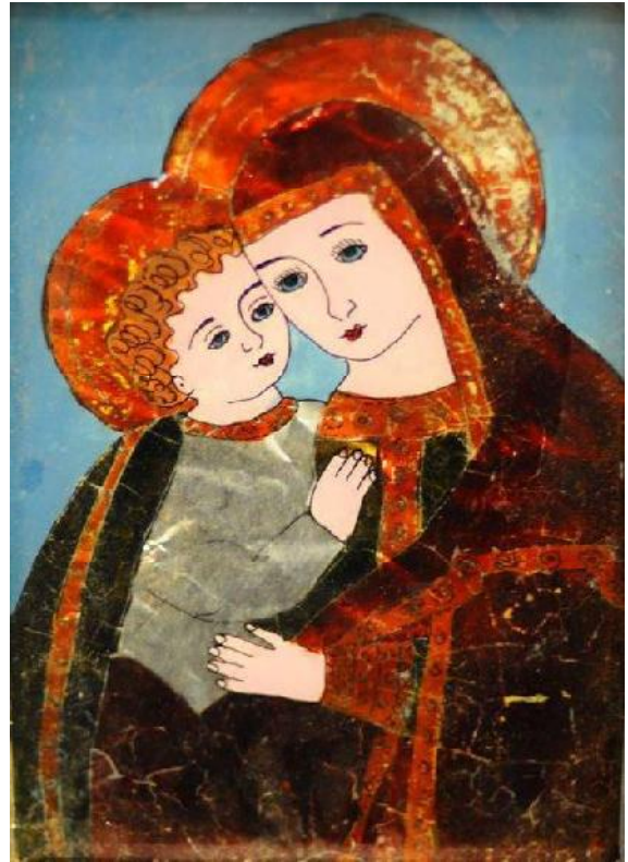
Іл. 5. Ікона, «Богородиця з дитям». Скло, олія, позлітка. Розмір 29 x 19 см. XX ст. 60-ті рр. Західна Україна (Тернопільщина). Приватна колекція