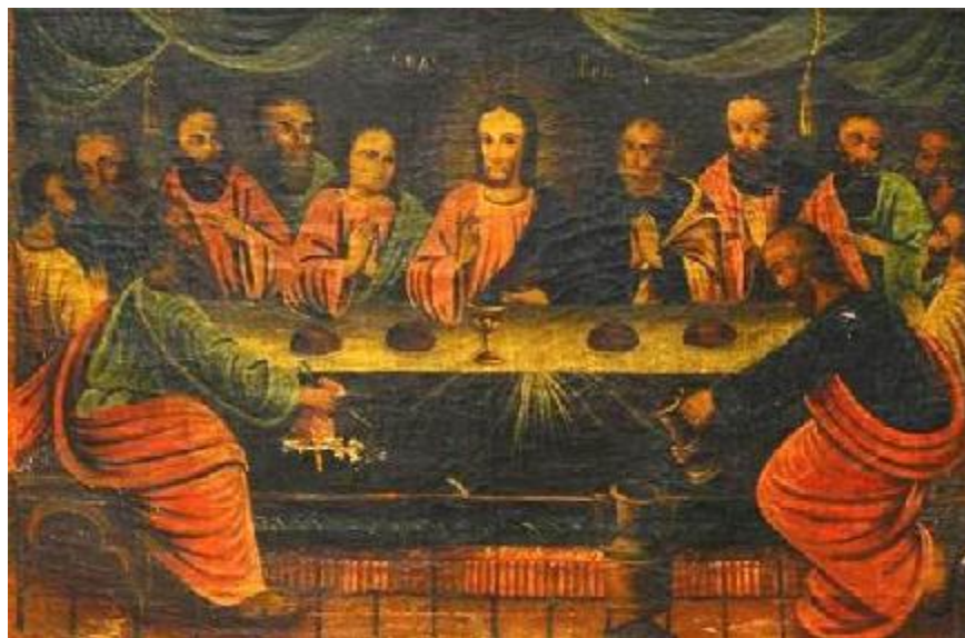
Л. 10. Ікона тридільна: «Святий Миколай» (I); «Тайна вечеря» (II); «Свята Параскева» (III). Полотно, олія. Розмір 59 x 168 см. ХІХ ст. Східне Поділля. Приватна колекція