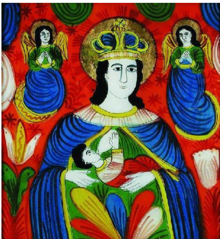
Гл. 2. Ікона, «Богородиця Годувальниця». Скло, олія. Кін. ХІХ ст. Гуцульщина. Приватна колекція