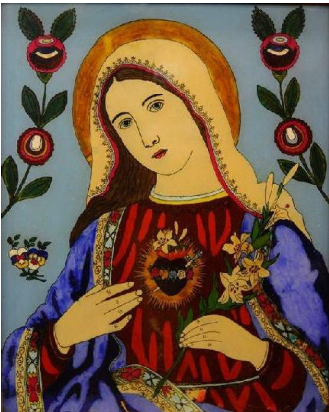
Іл. 6. Ікона, «Богородиця Палаюче Серце». Скло, олія. Розмір 50 x 40 см. XX ст. 60-ті рр. Західна Україна (Івано-Франківщина). Приватна колекція