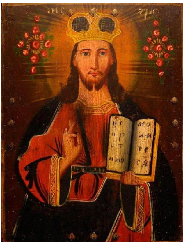
Іл. 17. Ікона, «Христос Вседержитель». Дерево, олія. Розмір 30 x 39,5 см. XIX ст. Чернігівське Полісся. Приватна колекція «Українського професійного банку»