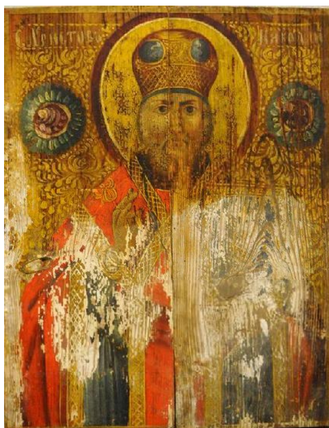
Гл. 14. Ікона, «Святий Миколай». Дерево, олія. Розмір 51 x 39,5 см. XIX ст. Чернігівське Полісся. Приватна колекція