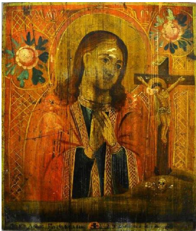
Іл. 15. Ікона, «Богородиця Охтирська». Дерево, олія. Розмір 52,5 x 44 см. XIX ст. Чернігівське Полісся. Приватна колекція