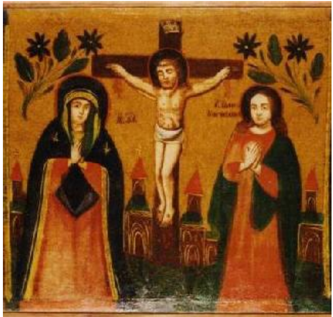
Іл. 8. Ікона тридільна: «Розп'яття з пристоячими Богородицею та Іоаном Богословом» (II); «Святий Стефан» (I); «Свята Варвара» (III). Полотно, олія. Розмір 63,5 x 144,6 см. I пол. XIX ст. Східне Поділля. Український центр народної культури «Музей Івана Гончара» (інв. КН-4769)