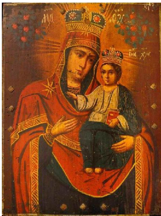
Іл. 18. Ікона, «Богородиця Одигітрія». Дерево, олія. Розмір 31 x 39 см. XIX ст. Чернігівське Полісся. Приватна колекція «Українського професійного банку»