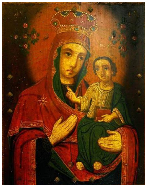
Іл. 16. Ікона, «Богородиця Одигітрія». Дерево, олія. Розмір 31 x 39,5 см. XIX ст. Чернігівське Полісся. Приватна колекція «Українського професійного банку»