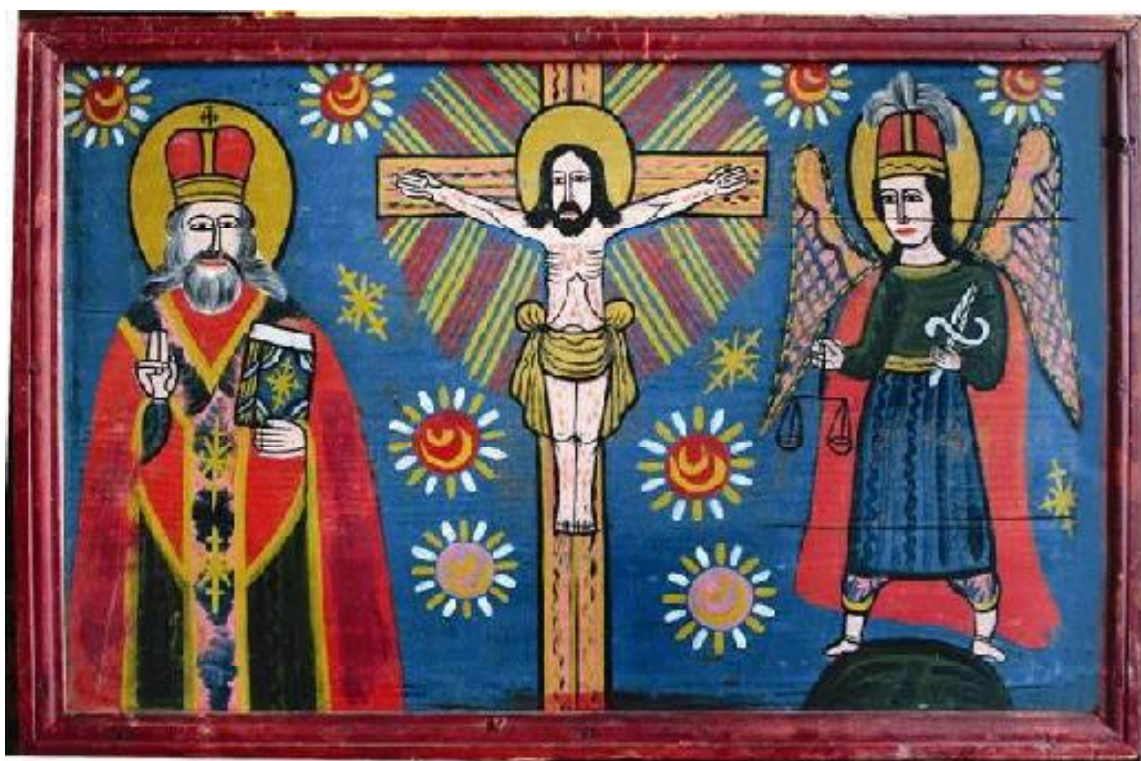
Л. 11. Ікона, «Святий Миколай, Розп'яття, Архангел Михайл». Фанера, олія. Розмір 41,5 x 63 см. Кін. ХІХ ст. Західна Україна (Буковина). Приватна колекція о. Зенона Хоркавого