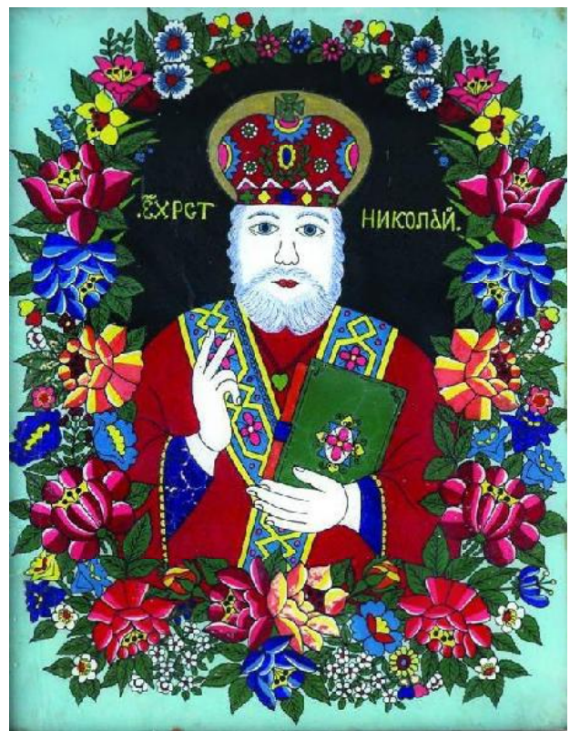
Іл. 7. Ікона, «Святий Миколай». Скло, олія. Розмір 39,5 x 51,5 см. XX ст. 60-ті рр. Івано-Франківщина. Приватна колекція