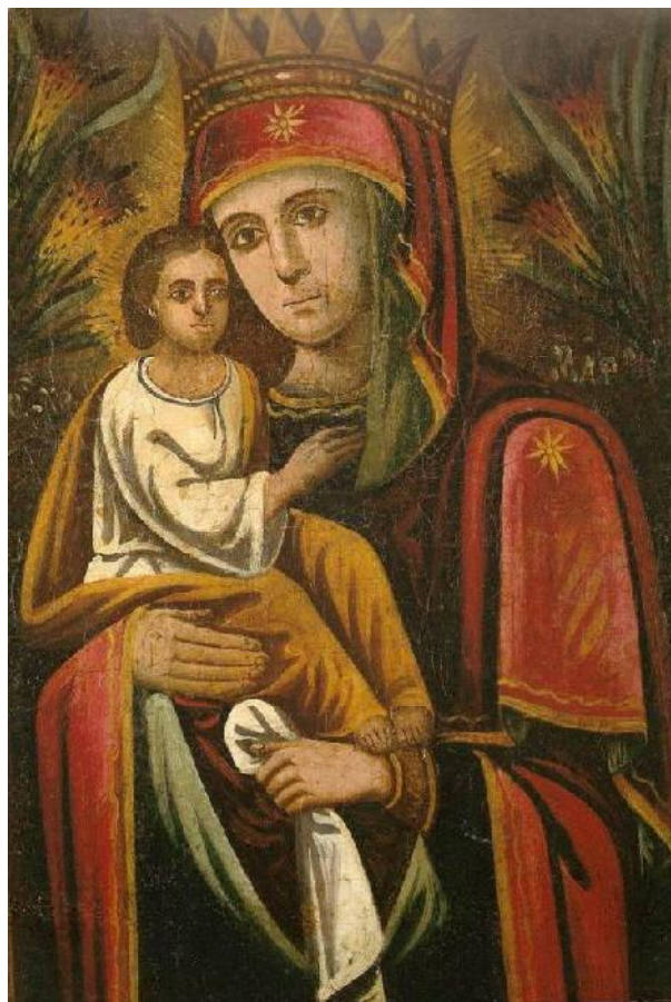
Гл. 3. Ікона (фрагмент), «Богородиця Почайівська». Полотно, олія. Розмір 55,5 x 176 см. ХІХ ст. Східне Поділля. Приватна колекція Ольги Богомолець