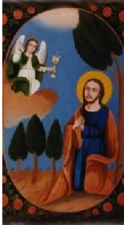
Лл. 9. Ікона п'ятидільна: «Святий Миколай» (I); «Благовіщення» (II); «Коронування Богородиці» (III); «Моління Христа про чашу» (IV); «Свята Варвара» (V). Полотно, олія. Розмір 62,3 x 180 см. Кін. XIX – поч. XX ст. Поділля. Український центр народної культури «Музей Івана Гончара» (інв. КН-4520)