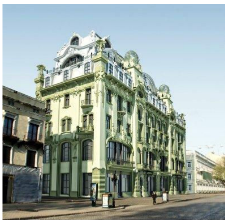
Мал. № 7,8 Гостиниця "Велика Московська" (Одеса)