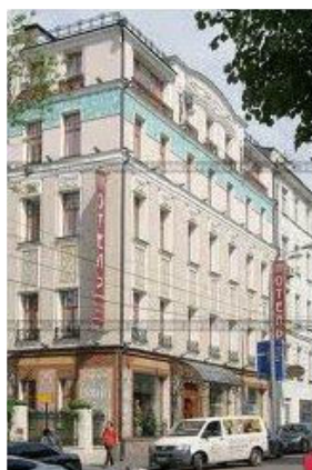
Мал. № 3, 4 Готельно-ресторанний комплекс "Руссо-балт" (Москва)