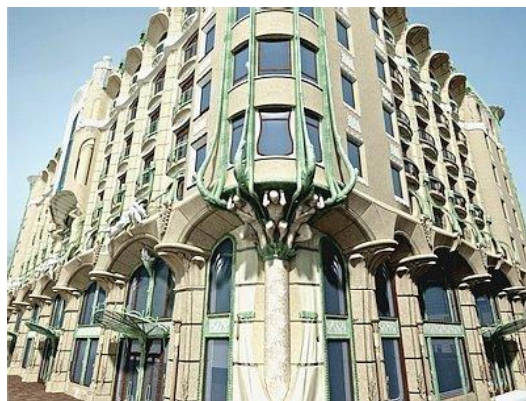
Мал. № 1 Готельно-ресторанний комплекс "Імперіал" (Одеса) Мал. № 2 Композиційні вузли ГРК "Імперіал"