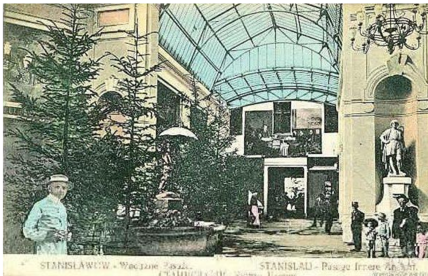
Рис.1. Інтер'єр пасажу Гартенбергів, Станіславів, 1904, вул. Сапіжинська (вул. Незалежності, 3)