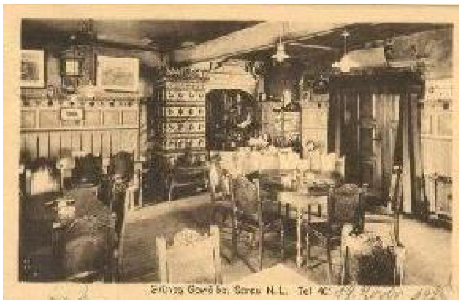
Рис.5. Інтер'єр цукерні «Затишок» («Затишия»), Станіславів, 1920-ті вул. Каземирівська, 9 (вул. Гетьмана Мазепи)