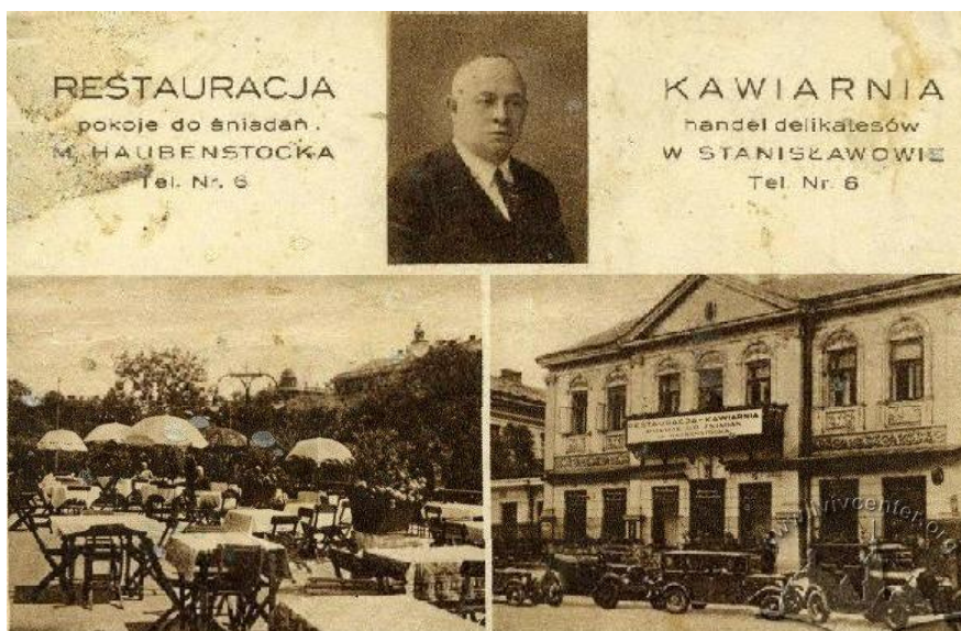
Рис. 3. Ресторан та кав'ярня М.Гаубенишока, Станіславів, 1915, вул. Собеського (вул. Січових Стрільців, 18)