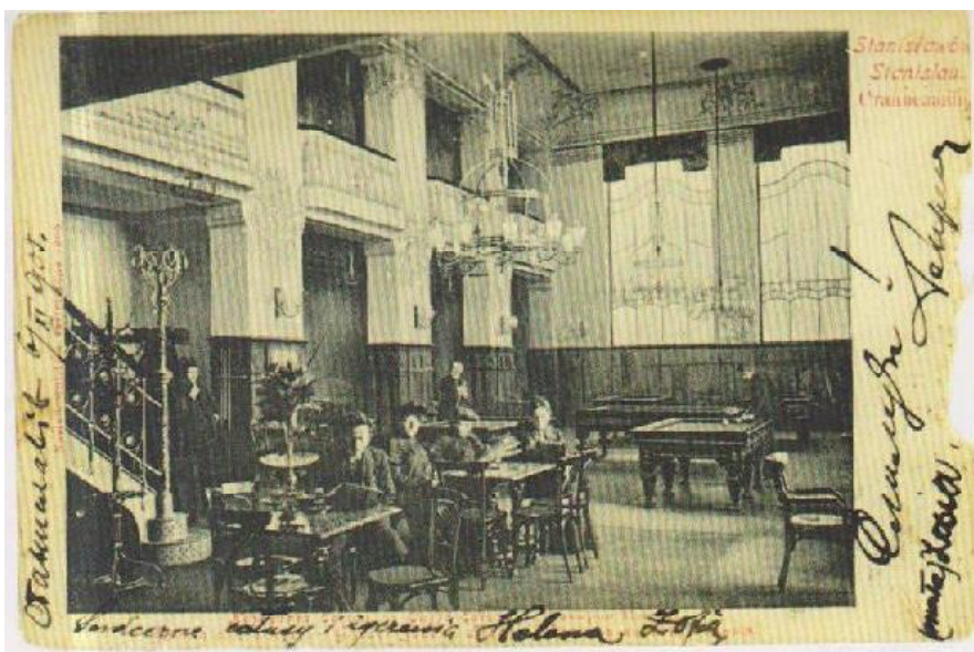
Рис.2. Інтер'єр кав'ярні «Edison» («Едісон») у пасажі Гартенбергів, Станіславів, 1905