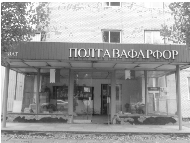
Фото 6. Вхід а адміністративне приміщення ПФЗ. Сучасний стан. – жовтень, 2011