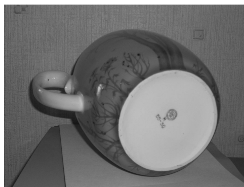
Фото 4-5. Чайник з сервізу чайного «Настрій» з приватної колекції Тетяни Зіненко. – жовтень, 2011