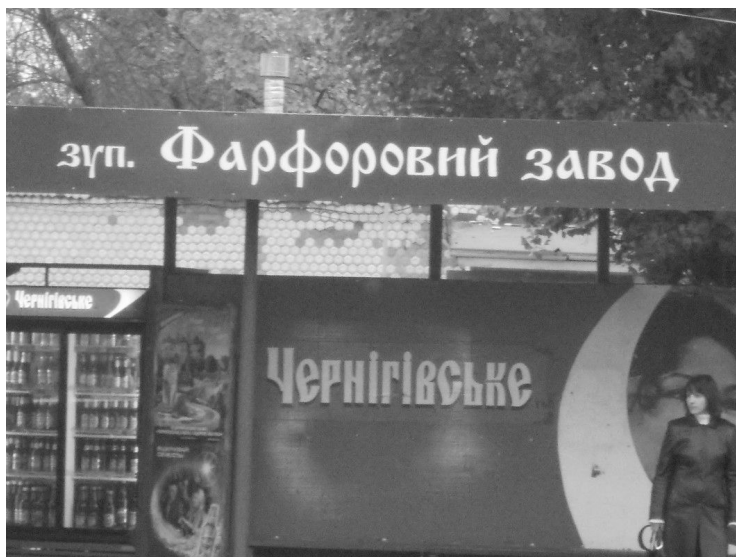
Фото 2. Тролейбусна зупинка «Фарфоровий завод» у Полтаві. – жовтень, 2011. Публікується вперше