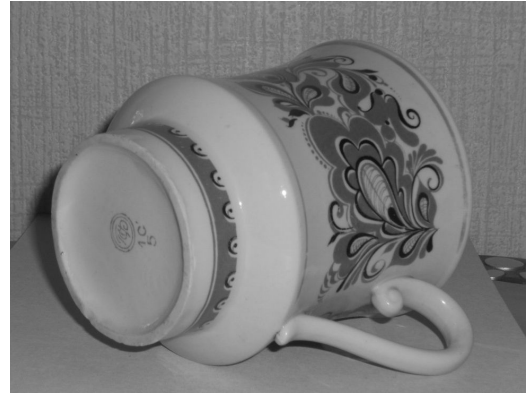
Фото 8. Чашка подарункова «Червоне і чорне» форма І.Віцька, малюнок Н.Ромашова. ПФЗ. – жовтень, 2011. Публікується вперше