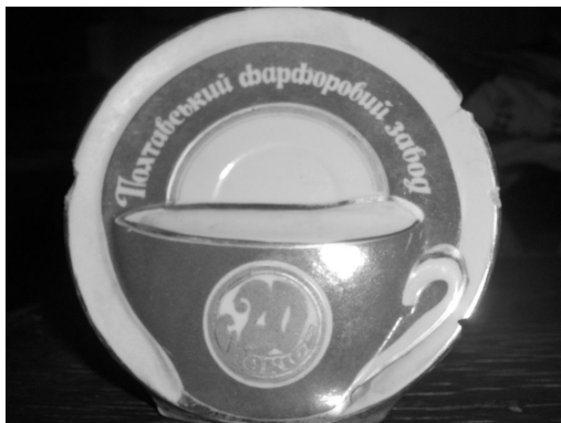
Фото 1. Ювілейний знак, виготовлений з нагоди 20-річчя ПФЗ. – жовтень, 2011. Публікується вперше