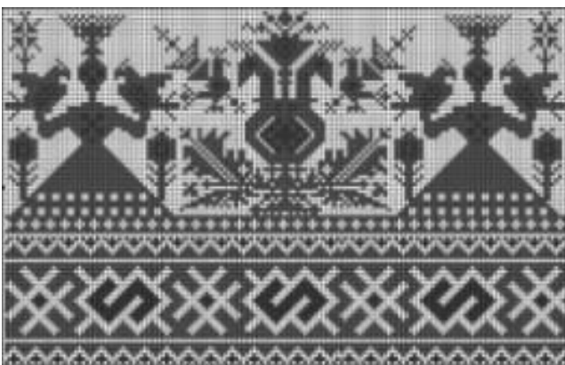
Рис. 5. Жіноча постать Берегині з двома птахами в руках на рушнику