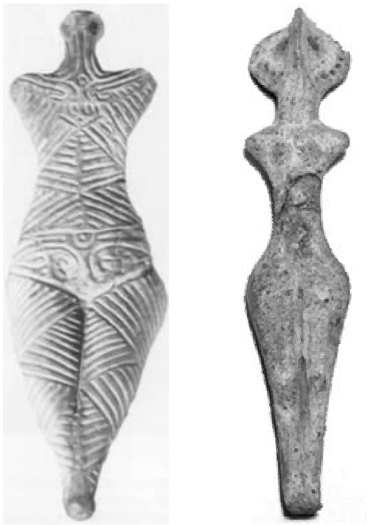
Рис. 1. Трипільські жіночі статуетки