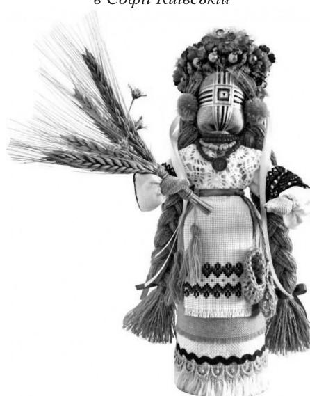
Рис. 4. Оберіг лялька-мотанка