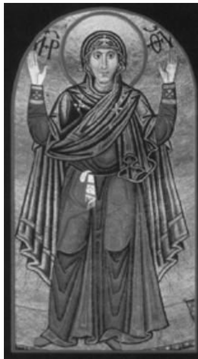
Рис. 3. Богоматір Марія–Оранта в Софії Київській