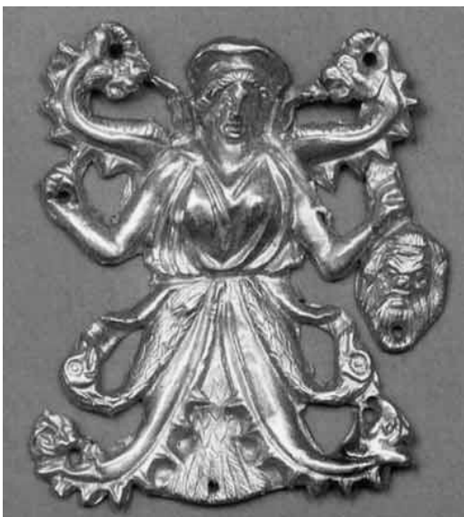
Рис. 2. Скіфська богиня Ані дружина Папая (дочка ріки Борисфен (Дніпра), Золото, Куль-Оба, IV ст. до н. е.