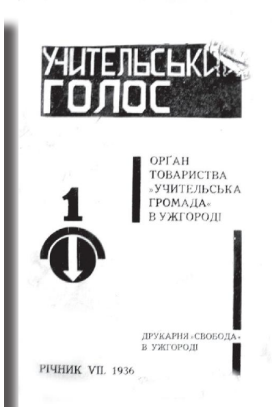
Рис. 4. «Учительський голос», 1936, річник VII, число 1.