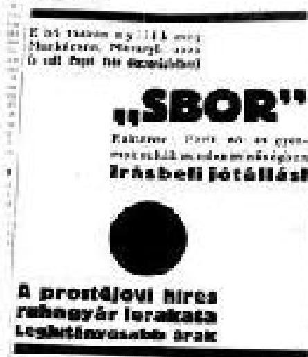
Рис. 7. «Ужгород», 1935, март, 15, 1-й выпуск, 2-й номер, с. 4.