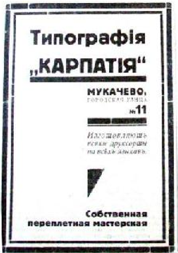
Рис. 8. «Земледельческая политика», 1929, июль, 13, годъ издания IX, № 27, с. 4