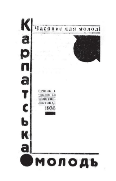
Рис. 3. «Карпатська молодь», 1936, жовтень-листопад, річник I, число 2-3.