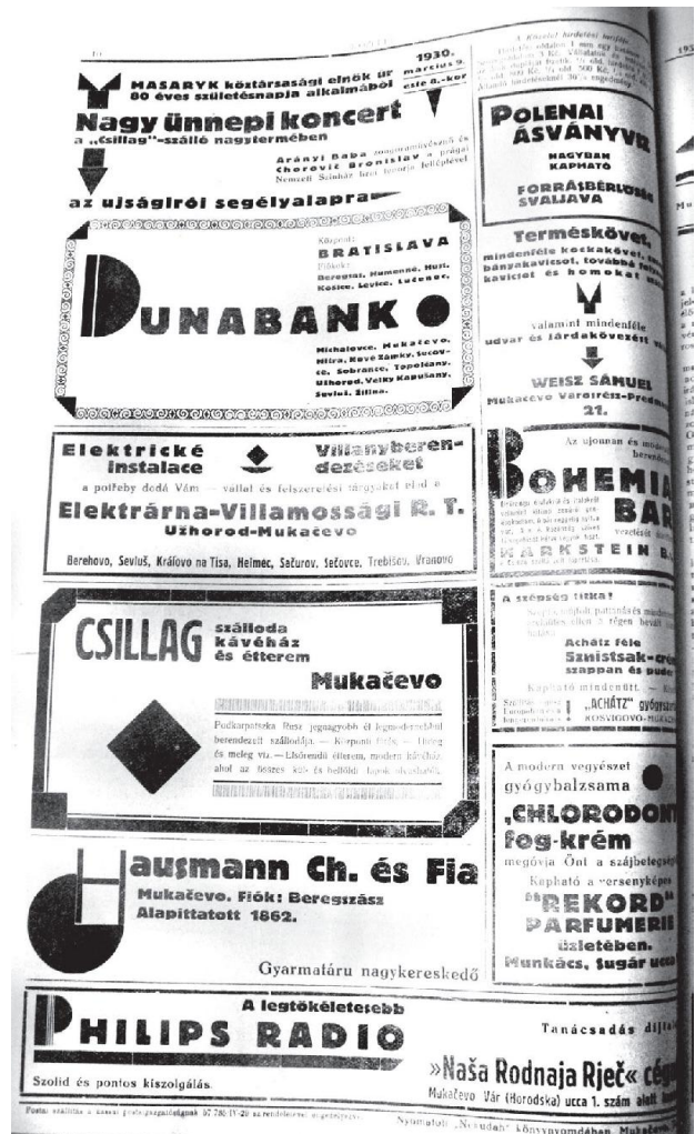
Рис. 2. «Közélet», 1933, március, 7, II evt., 9-10 szám, oldal 10.