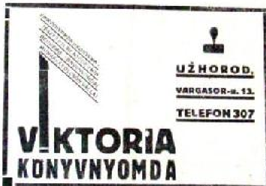
Рис. 9. «Мартъ», 1914, мартъ, 30, XIV выпускъ, 15, 1-й номер, с. 4.