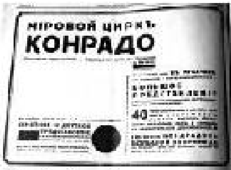
Рис. 6. «Земледельческая политика» – 1929, июль, 13. годъ издания III, № 27, с. 4.