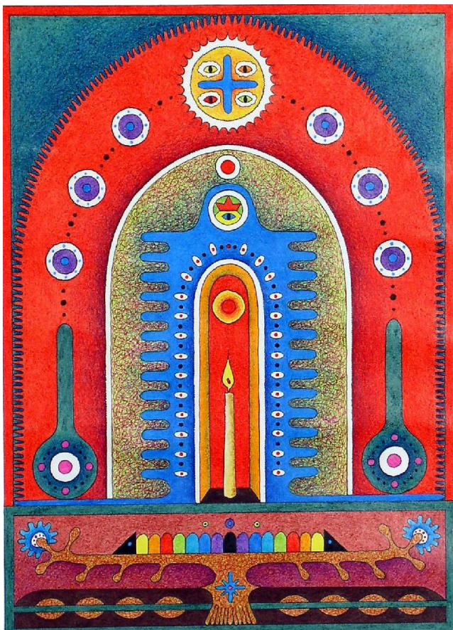
Пам'ять. 1996, 26x35, папір, кольоровий олівець.