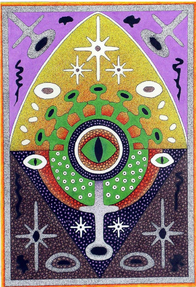
Бумеранг. 1997, 28,5x40,5, папір, кольоровий олівець.