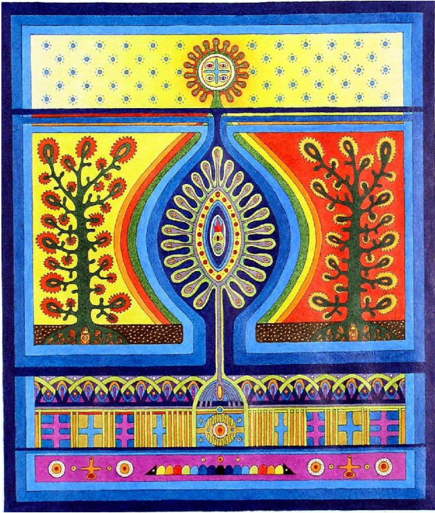
Жива крапля дощу. 1997, 35x40, папір, кольоровий олівець