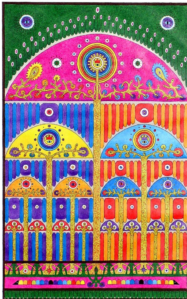
Дерево життя. 1997, 24,5x39, папір, кольоровий олівець.

сунком, композиційними ритмами елементів-символів чи естетизмом кольорової гами – вони, як каже сама художниця: «Переважно це послання про те, що люди повинні замислитись над своїми вчинками».