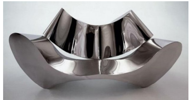
Рон Арад. Диван D 'A. Полірована Нержавіюча сталь