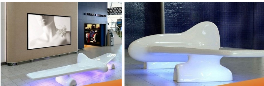
Аеропорт Тієр, Амстердам