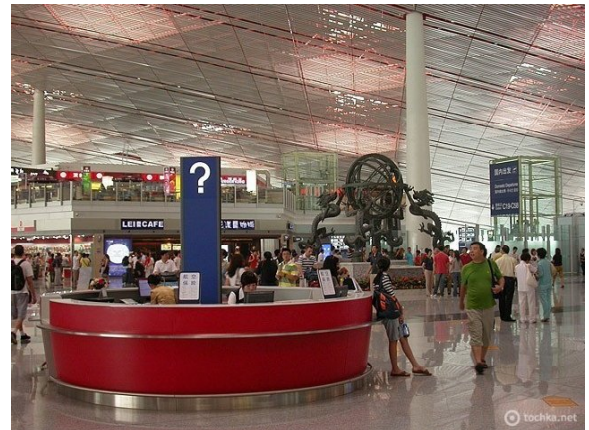
Beijing International, Кумай