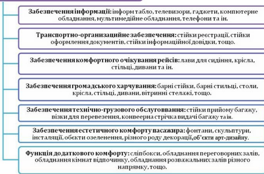
Рис. 2 – Класифікація об'єктів промислового дизайну та інтер'єрного наповнення аеровокзалів за функціональними особливостями