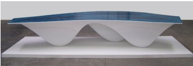
Заха Хадід. Стіл Aqua. Поліуретан, силікон