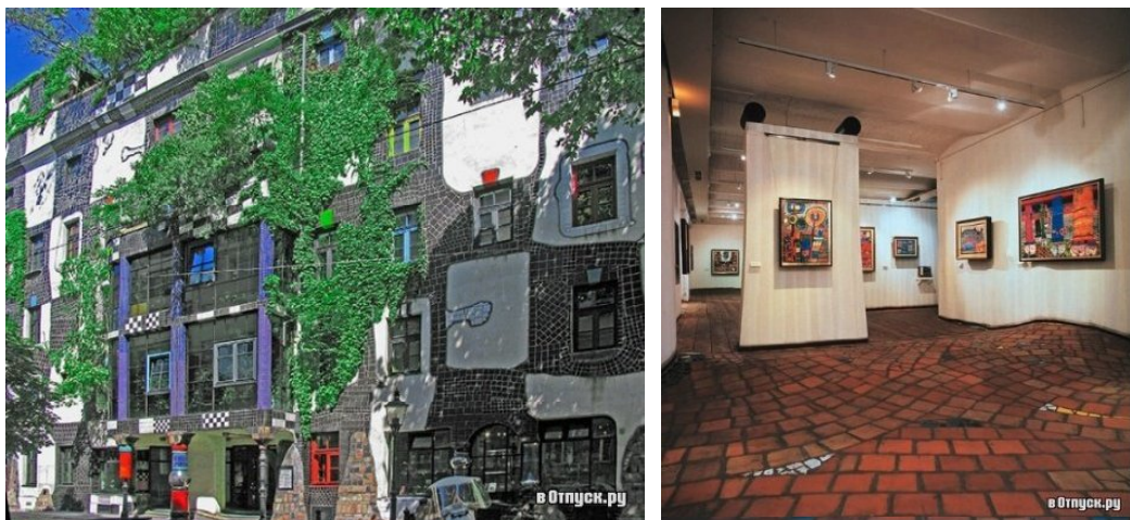
Рис. 8 Віденський будинок мистецтв