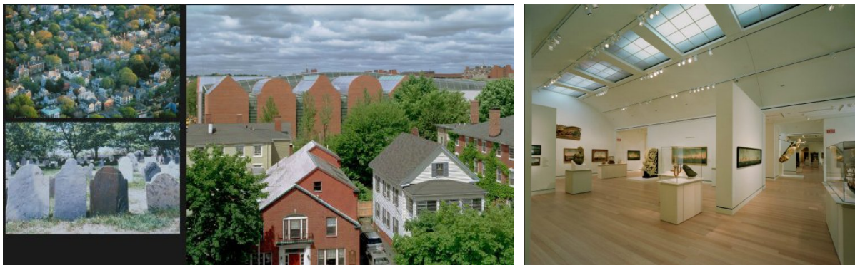
Рис. 11. Музей Peabody Essex Museum. Арх. Моше Сафді.