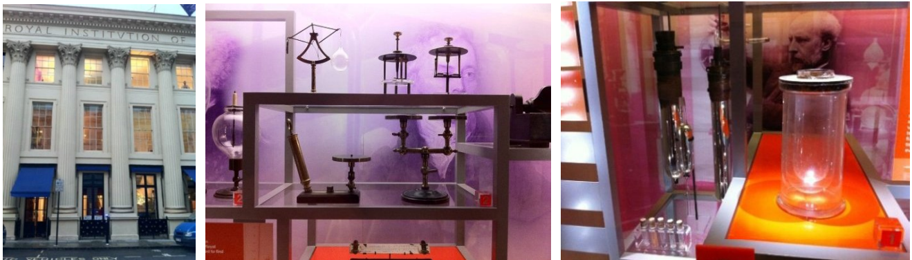
Рис. 3 Музей Фарадея