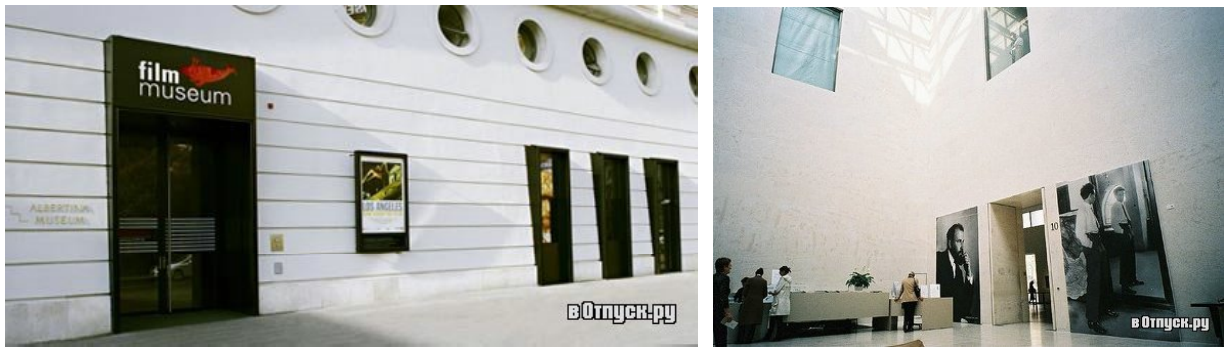
Рис. 5 Австрійський музей кінематографії