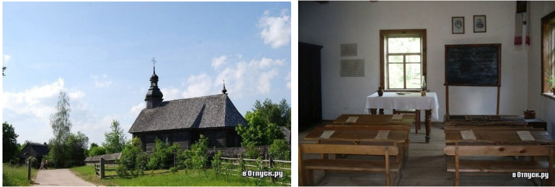
Рис. 9 Білоруський музей народної архітектури та побуту