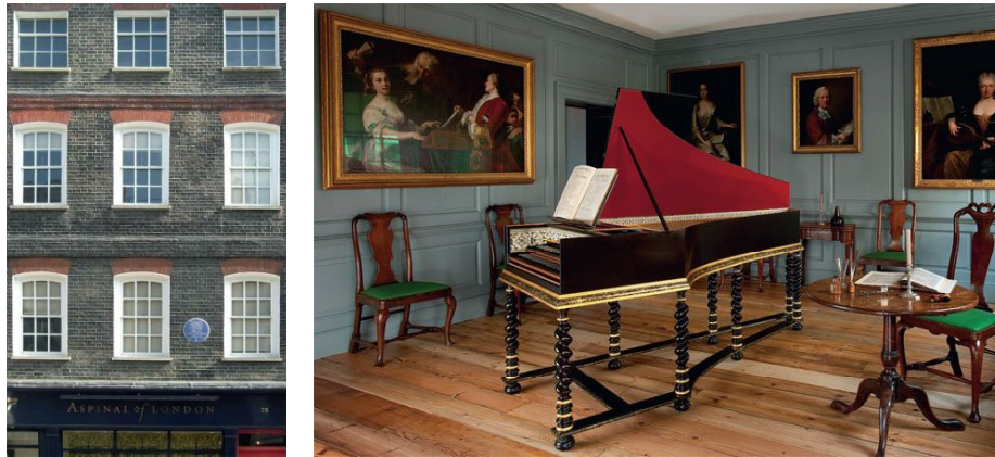
Рис. 1 В історичній будівлі стиль інтер'єру відповідає стилю фасаду. Будинок-музей Генделя