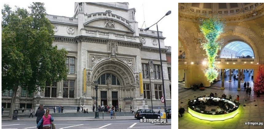
Рис. 2 Музей Вікторії та Альберта