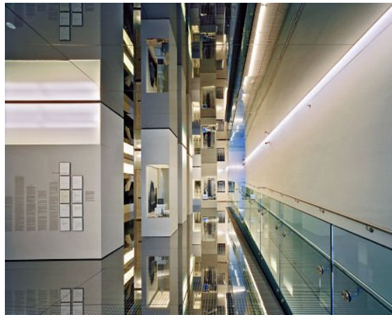
Рис. 10 Skyscraper Museum