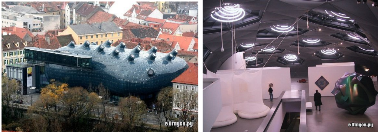
Рис. 6 Художній музей в місті Грац, Австрія. Архітектори Пітер Кук та Колін Фурньє