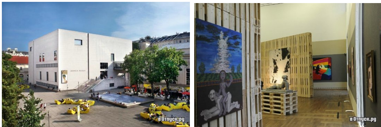
Рис. 7 Музей Леопольда у Відні