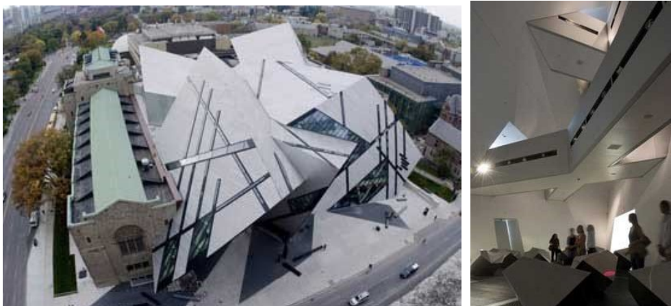
Рис. 12 Королівський музей Онтаріо. Арх. Френк Дарлінг, Джон Пірсон, Альфред Чапман, Джеймс Окслі, Деніел Лібескінд.