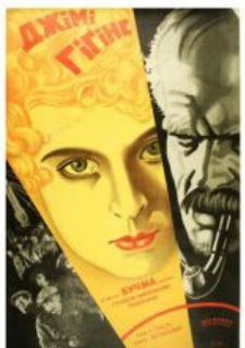
Рис. 9. Кіноплакат «Дядько Гітис» 1930 р.