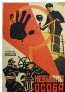
Рис. 11. Кіноплакат «Невідома особа» 1930 р.