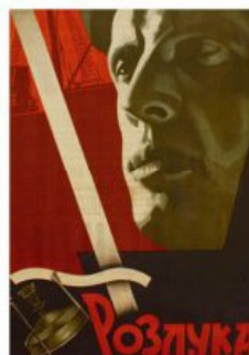
Рис. 15. Кіноплакат «Розтук» 1930 р.

на них виконані українською мовою, що становлять невід'ємну частину композиції художнього образу.