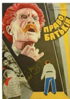
Рис. 3. Кіноплакат «Право батьків» 1928 р.