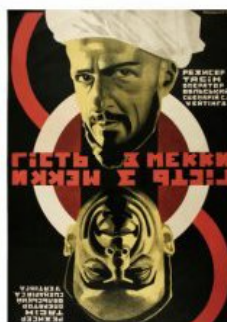
Рис. 14. Кіноплакат «Гість з Мекки» 1930 р.