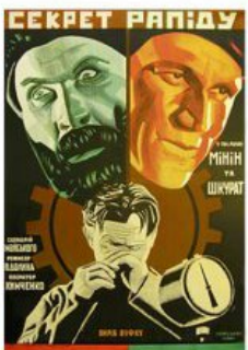
Рис. 10. Кіноплакат «Секрет рапід» 1930 р.