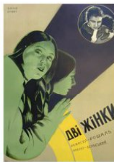
Рис. 4. Кіноплакат «Дві жінки» 1929 р.