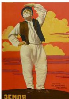
Рис. 5. Кіноплакат «Земля» 1930 р.