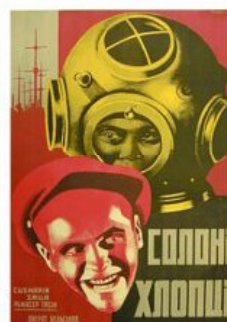
Рис. 15. Кіноплакат «Солоні хлопці» 1930 р.