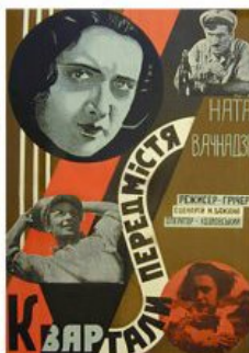
Рис. 6. Кіноплакат «Квартира на висоті» 1929 р.