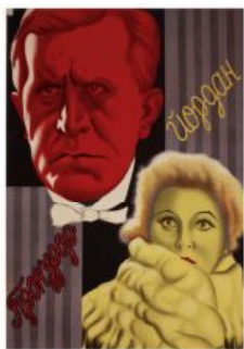
Рис. 1. Кіноплакат «Прокурор Йордан» 1928 р.