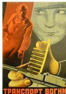
Рис. 8. Кіноплакат «Транспорт воєни» 1930 р.