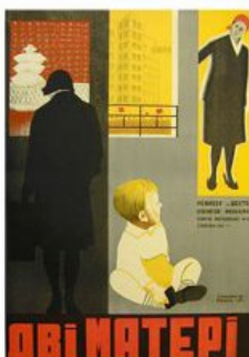
Рис. 13. Кіноплакат «Дві матері» 1931 р.