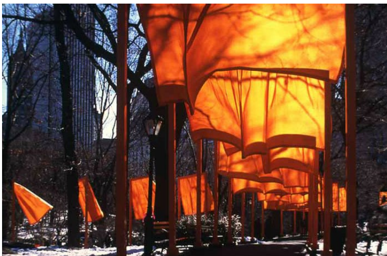
Фото 5. Кристо и Жан Клод. Ворота Центральный Парк, Нью-Йорк. 2005