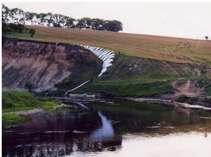
Фото 3. Дорога. Наталья Кохан. 2003