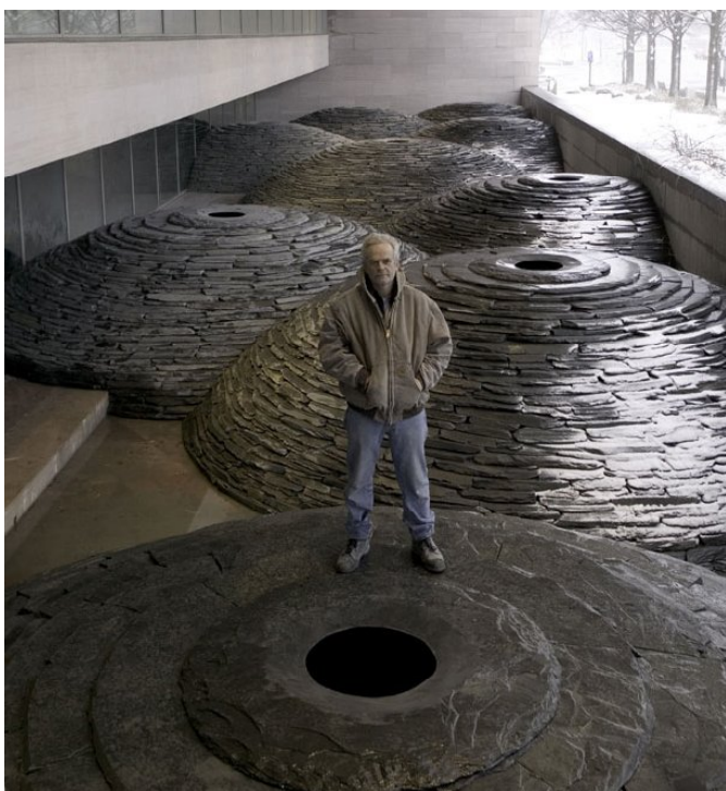
Фото 7. Энди Голсуорси. Полусферы. 2005

ный рельеф места, выделив некоторые его части красной глиной.