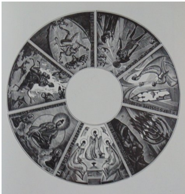
Ил. 6. А. Савич. Эклибрис Дж. Миранелла. Ксилография

вид графики и продемонстрировать международному художественному сообществу уровень профессионализма украинских мастеров. Это выставки 1994 г. «Женщина в эклибрисе» и «Религий много – Бог один».