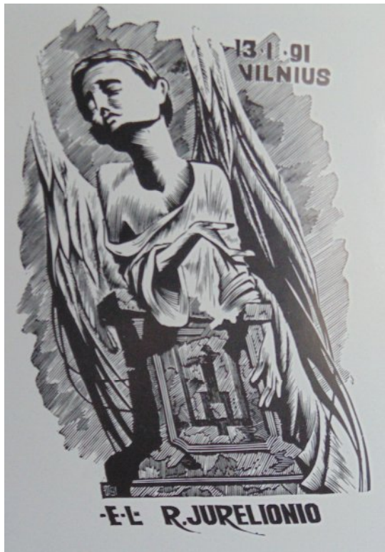
Ил. 8. Ю. Галицын. Эклибрис Р. Юрелионио. Ксилография