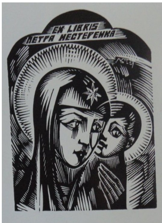
Ил. 7. В. Ломака. Эклибрис П. Нестеренко. Ксилография.