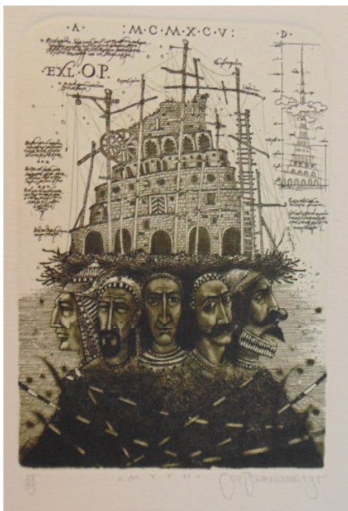
Ил. 10. О. Денисенко. Экслибрис О.Р. Офорт