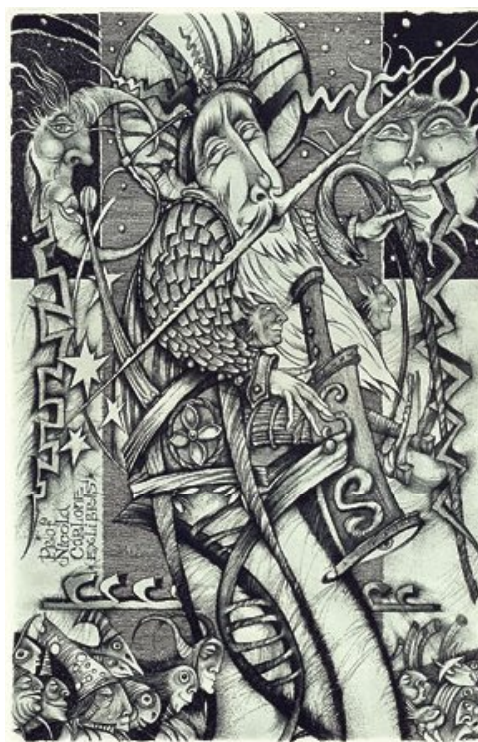
Ил. 11. С. Храпов. Экслибрис Н. Карлоне «Миф». «Демидург». Офорт, акватинта, меццо-тинто

Выводы и перспективы дальнейших исследований. Каждый из украинских мастеров, известный сегодня за пределами страны, требует актуализации своего творчества в самой Украине с целью ликвидации дисбаланса между признанием в странах зарубежья и отсутствием известности в своей стране. Украинская публика, как любители искусства, так и коллекционеры, еще не вполне готовы к тому восприятию графики, в частности – графики малых форм, которым характеризуется западноевропейское арт-сообщество. Поэтому среди основных задач искусствоведов сегодня – ликвидировать этот пробел и способствовать тому, чтобы украинские мастера получали признание, прежде всего, у себя в стране, что, в свою очередь, будет благоприятствовать и прекращению оттока художественной элиты за пределы страны.