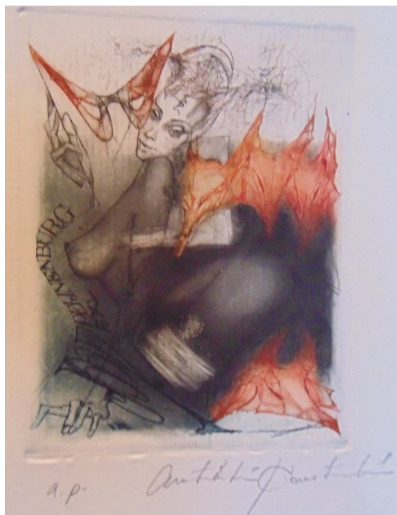
Ил. 9. К. Антюхин. Эклибрис Й. Пейненбурга. Офорт, сухая игла, акватинта, меццо-тинто