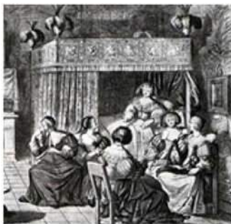
Рис.1.1 «Салон маркизи Рамбул'є» [Електронний ресурс]-(Режим доступу): http://expositions.bnf.fr/bosse/grand/080.htm (10.04.2014)