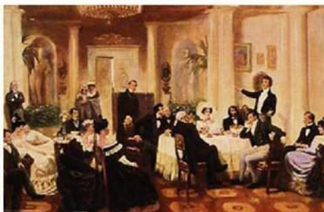
Рис.1.5 «Салон в середині 19 ст.» Росія [Електронний ресурс]: Вікіпедія – Режим доступу: http://en.wikipedia.org/wiki/Salon_(gathering) – (11.03.2014)