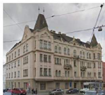
Рис.1.7 «Літературно-мистецька спілка» Львів [Електронний ресурс]: – Режим доступу: http://www.panoramio.com/photo/82069917 (11.03.2014)