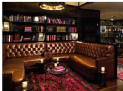
Рис.1.10 «Інтер'єр літературного салону «Pen Parentis» у Нью Йорку» [Електронний ресурс] – Режим доступу: http://www.penparentis.org/ (12.04.2013)