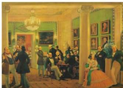
Рис.1.4 «Салон в середині 19 ст.» Росія [Електронний ресурс]: Вікіпедія – Режим доступу: http://en.wikipedia.org/wiki/Salon_(gathering) (11.03.2014)