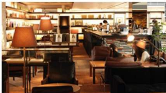
Рис.1.9 «Вітальня-кафе Daikanyata T-Site», Токіо [Електронний ресурс]- Режим доступу: http://eatocracy.cnn.com/2012/01/23/manga-maids-need-not-apply-japans-high-end-concept-cafes-come-of-age/ (12.04.2013)