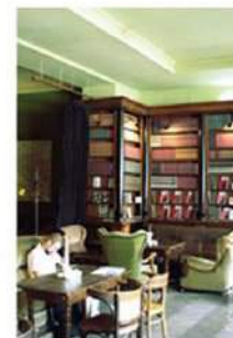
Рис.1.11 «Інтер'єр кафе «Кабінет» у Львові» [Електронний ресурс] – Режим доступу: http://thegoort.blogspot.com/2012/09/blog-post_27.html (7.04.2013)