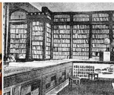
Рис.1.6 «Книгарня при салоні» Львів [Електронний ресурс]: Lviv4you – Режим доступу: http://www.lviv4you.com/tv/dosug-vo-lvove/archiv/462-книгоиздательство-львова.html (27.10.2014)