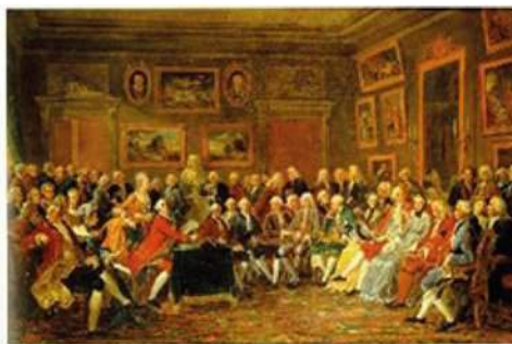
Рис.1.2 «Салон мадам Жоффрен(1755 р.)» [Електронний ресурс]: Вікіпедія – Режим доступу: http://en.wikipedia.org/wiki/Salon_(gathering) (11.03.2014)