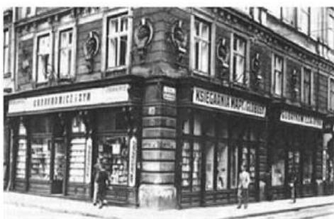
Рис.1.6 «Літературний салон Губринович і син», Львів [Електронний ресурс]: – Режим доступу: https://www.facebook.com/photo.php?fbid=564341300277610&set=a.500185703359837.115446.500183736693367&type=1 (11.03.2014)