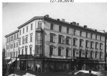
Рис.1.8 «Літературно-мистецька спілка» Львів [Електронний ресурс]: – Режим доступу: http://io.ua/20223854 - (11.03.2014)